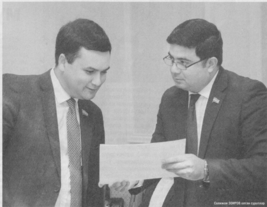
Солиқдор 2016 йил 27-октябрь