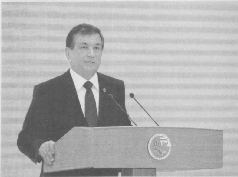
44 Давоми. Бошланчи 1-саҳифада

Тадбиркорлар ва ишбилармонлар ҳаракати – Ўзбекистон Либерал-демократик партиясидан Ўзбекистон Республикаси Президентлигига номзод Шавкат Мирзиёев шу кун Фарғона вилояти сайловчилари билан ҳам учрашди.