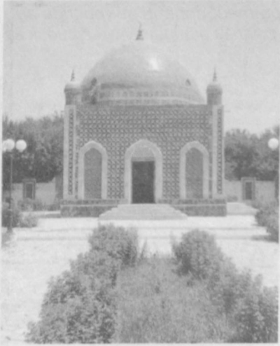
Қуёш нурларини беркитиб бўлмаганидек, ҳақиқатнинг чирогини ҳам сўндириб бўлмас.

Ёзилган китоб нусхасининг тўғрилиги кўз қорачигининг боққанига боғлиқдир, ривоятнинг инобатлиси (ишончлиси) эса сероб сувдан ҳам ортиқроқ қондирар.