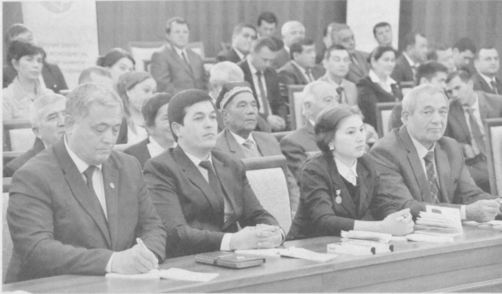
« Давоми. Бошланғич 1-саҳифада

Тадбиркорлар ва ишбилармонлар ҳаракати – Ўзбекистон Либерал-демократик партиясидан Ўзбекистон Республикаси Президентлигига номзод Шавкат Мирзиёев 15 ноябрь куни Сурхондарё вилояти сайловчилари билан учрашди.