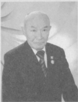
Абдулла ОРИПОВ, Ўзбекистон Қаҳрамони, халқ шоири: