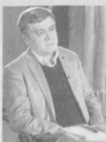
Хуршид ДАВРОН, Ўзбекистон халқ шоири.