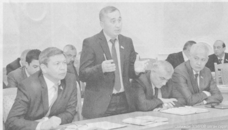
Солмакчи 30ИР0В олган сурат