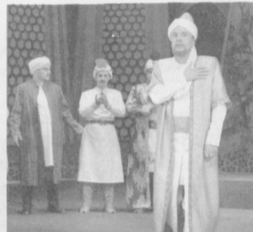
спектаклда ҳам ўзига хос ракурсларда очиб берилганига гувоҳ бўламиз.

Чиндан ҳам шоир ҳаёти катта ва суронли воқеликлар ичида ўтганлиги тарихдан маълум. Аммо ҳар икки ҳолатда ҳам унинг олий ҳақиқати кўнгилни муқаддас Каъба каби асраш, унга топиниш бўлиб қолди. Чунки бу образ шоирнинг ҳаётида ҳам, ижодида ҳам муҳим ўрин эгаллайди. У ҳеч қачон шохнинг олдида гадони, бойнинг олдида муҳтожни изза қилмайди. Дунё паст-баландликларини тенг кўради. Тил ва дил бирлигини умрининг сўнгги ўлжасига сақлай олди. Бу жиҳат