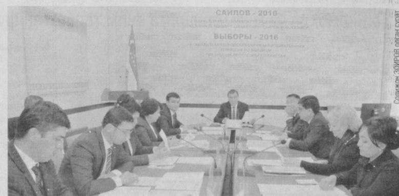
Солмакчи 30ИР0В олган сурат