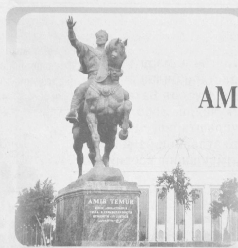
Азму жазм билан иш тутдим. Бирон ишни қилишга қасд қилган бўлсам, бутун зехним, вужудим билан боғлиб, битирмагунимча ундан кўлимни тортмадим.

этаётган сайловолди жараёнлари, тарихий ўзгаришлар, эришяётган ютуқларимиз, иқтисодий юксалишлар ҳақида гапириб бердим. Ишонасизми, ўша лаҳзаларда фахру ифтихорга тўлиб сўзлаётганман, бу дунёда мен ўзимни ниҳоятда бахтли инсон қиёфасида тасаввур қилардим. Она юртга қайтар эканман, гарчи йўл-йўлакай яна сал тобим қочса-да, руҳим тетик, кўксимда эса келажакка ишончининг ажиб бир ёқимли ҳислари жилва қилар, энг қувончлисми, яна саноқли дақиқалардан кейин... қуёшли ўлкам, бетакрор заминга қадам қўйишимни, фарзандларим, оила аъзоларим, қўни-қўшилларим, борингки, олисларда мен кўмсаган, соғинган бағрикенг, оқибатли юртдошларимни ўйлаб, киприқларим намланди.