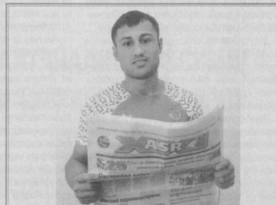
Фазлиддин ФОЙБАЗАРОВ, Олимпиада чемпиони: