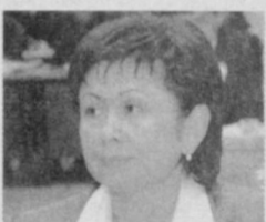
Клара ЖУМАМУРОВА , Олий Мажлис Қонунчилик палатаси депутати, Саноат, қурилиш ва савдо масалалари қўмитаси аъзоси:

14 та, ташқи иқтисодий фаолият бўйича 28 та, ишлаб чиқариш соҳасида 11 та рухсатнома бериш тартиби қолдирилмоқда. Уларнинг соҳалар бўйича тавсифлангани эса ўрта синф — мулкдорлар қатламнинг янада эркин фаолият юритишини таъминлашга хизмат қилади, албатта.