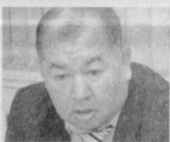
Собир ЖАББОРОВ , Олий Мажлис Қонунчилик палатаси депутати, Саноат, қурилиш ва савдо масалалари қўмитаси раиси:

Партия фаолларининг фикрича, ушбу дастурий ҳужжатда қайд этилган аксарият қонунлар кичик бизнес ва хусусий тадбиркорлик субъектлари манфаатларига қаратилгани учун ҳам ниҳоятда аҳамиятлидир. Уларни жойларда кичик бизнес ва хусусий тадбиркорлик субъектлари билан ўзаро ҳамкорликда ишлаб чиқиш эса қонунларнинг янада сифатли ҳамда мукамал бўлишини таъминлайди. Шу боисдан ҳам айтилган пайтда О'зЛиДеРнинг ҳудудий тадбирларида «Тадбиркорлик фаолияти соҳасидаги рухсатномалар бериш тартиб-қоидалари тўғрисида»ги қонун лойиҳаси ўрта синф вакиллари орасида катта қизиқиш уйғотиб, кенг муҳокамаларга сабаб бўлмоқда.