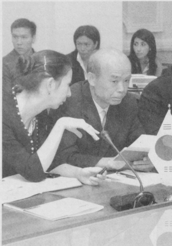
Давоми. Бошланиши 1-саҳифада