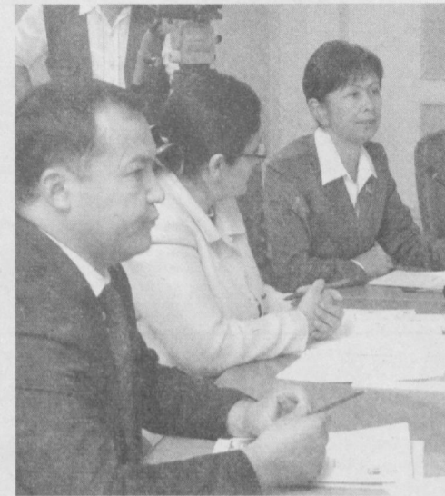
Давоми. Бошланиши 1-саҳифада