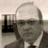
Кяхрамон ЭРГАШЕВ , Олий Мажлис Қонунчилик палатаси депутати, O'zLiDeP фракцияси аъзоси.

— Бугунгача тадбиркорлик субъектлари фаолиятига тўсиқ бўлаётган энг катта муаммолардан бири — улар фаолиятига асоссиз аралашувлар эди. Юртбошимиз тақлифи билан янги қонунга бундай ҳолатларнинг олдини олишга қаратилган янги меъёрлар киритилди. Жумладан, бундан буён кичик тадбиркорлик субъектлари ва фермер ҳўжалиklarининг молия-ҳўжалик фаолиятини режалли текшириш кўпи билан турт йилда бир марта, бошқа тадбиркорлик