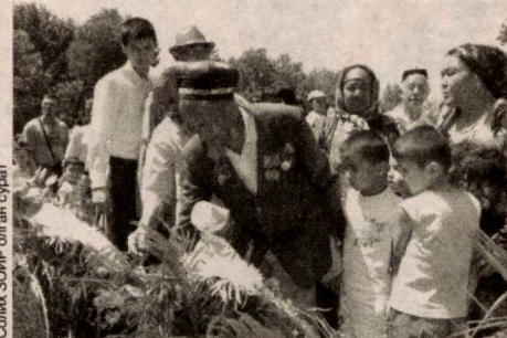
Сониқ ЗОИР олган сурат