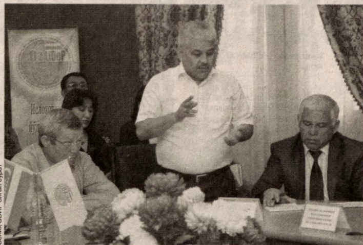
Солмақ, ЗОИРП олган сурат