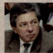
Равил СОБИРЖОНОВ, Олий Мажлис Қонунчилик палатаси депутати, O'zLiDeP фракцияси аъзоси:

МАҚСАД — ЎРТА СИНФНИ ҲАР ТОМОНЛАМА ҚўЛЛАБ-ҚУВВАТЛАШ