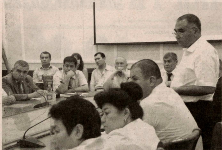
Давоми. Бошланиши 1-саҳифада