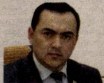
Абдуқодир ТОШҚУЛОВ, Олий Мажлис Қонунчилик палатаси депутаты, O'zLiDeP фракцияси аъзоси

СУРХОНДАРЁ ВИЛОЯТ КЕНГАШИ СЕССИЯСИДА БИЛДИРИЛГАН ТАКЛИФ ВА МУЛОҲАЗАЛАР O'ZLiDEP ФАОЛИЯТИНИ ЖОНЛАНТИРИШ, ПАРТИЯНИНГ ҚИШЛОҚ МУЛҚДОРЛАРИГА БўЛГАН ЭЪТИБОРИНИ ЯНАДА КУЧАЙТИРИШ ЛОЗИМЛИГИНИ КўРСАТДИ