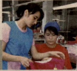
«Микрокредитбанк»: кичик бизнесга — 202 миллиард сўм