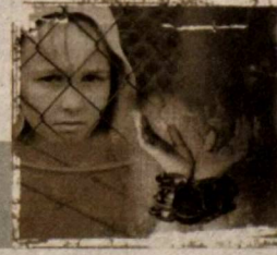
13-15 ёшли қизлар ҳам ана шундай гирдобга тортилмоқдалар