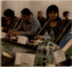
Тадбиркор аёл — оила таянчи

2012 йил 11 октябрь, пайшанба, 41 (465)-сон