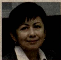
Клара ЖУМАМУРОВА, Олий Мажлис Қонунчилик палатаси депутати, O'zLiDeP фракцияси аъзоси