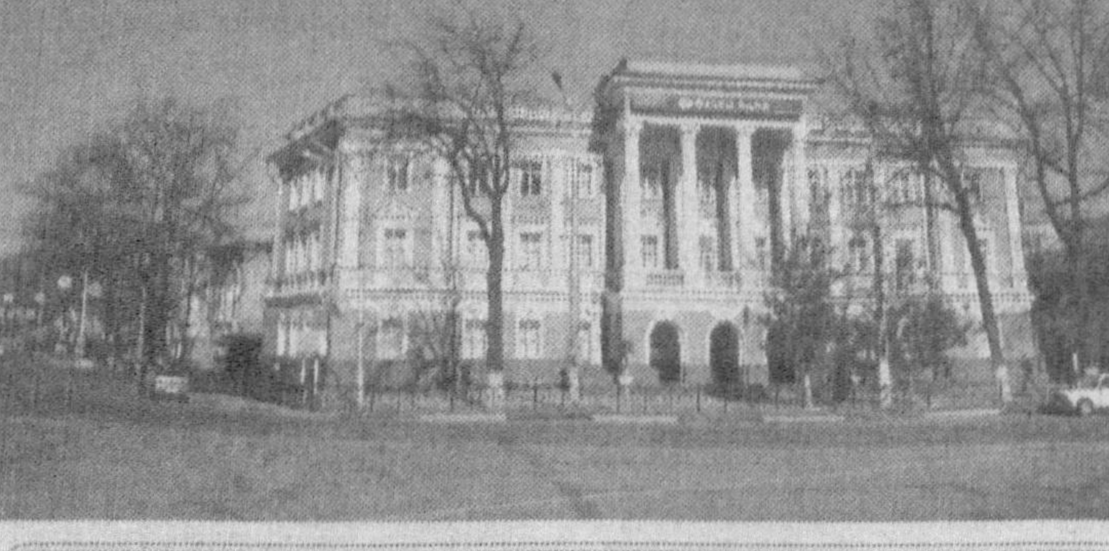
Музейнинг мукамал каталоги