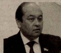
Қаҳрамон ЭРҒАШЕВ, Олий Мажлис Қонунчилик палатаси депутати, O'zLiDeP фракцияси аъзоси

Аммо бугунги глобаллашув жараёнлари аграр секторда ҳам инновацияларни жорий этиш, юзага келган экологик вазиятлардан келиб чиқиб самарали чоратadbирлар ишлаб чиқишни тақозо этаётди. Бунда, энг аввало, фермер хўжаликлари фаолиятини янада такомиллаштириш ва уларнинг ҳуқуқ ва ваколатларини кенгайтириш, ер-сув ресурсларидан ва яратилган ишлаб чиқариш салоҳиятидан фойдаланиш масаласига эътибор кучайтирилиши-