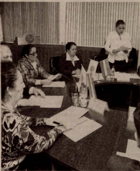
Давоми. Бошланиши 1-саҳифада