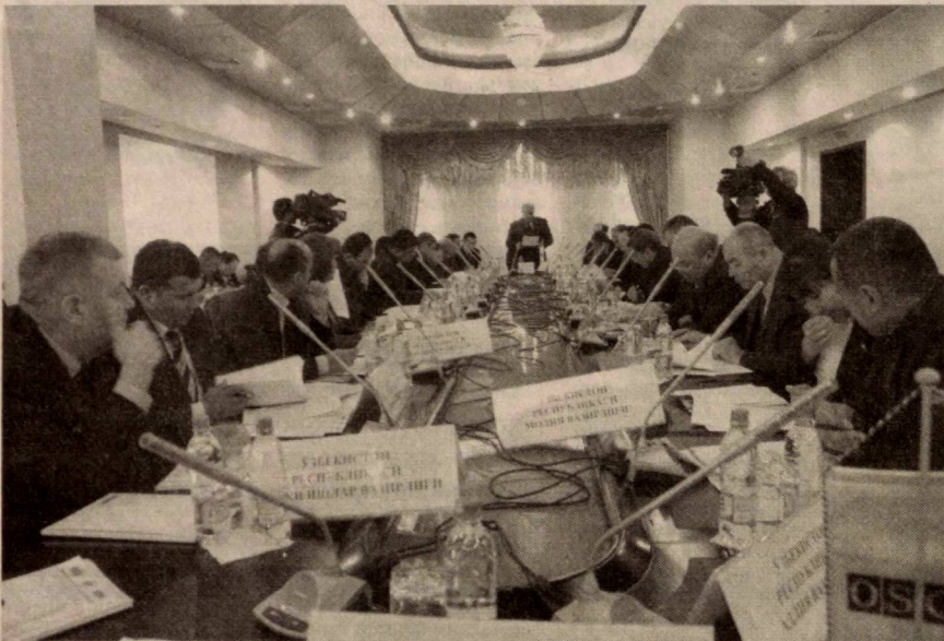
Давоми. Бошланиши 1-саҳифада ◀◀