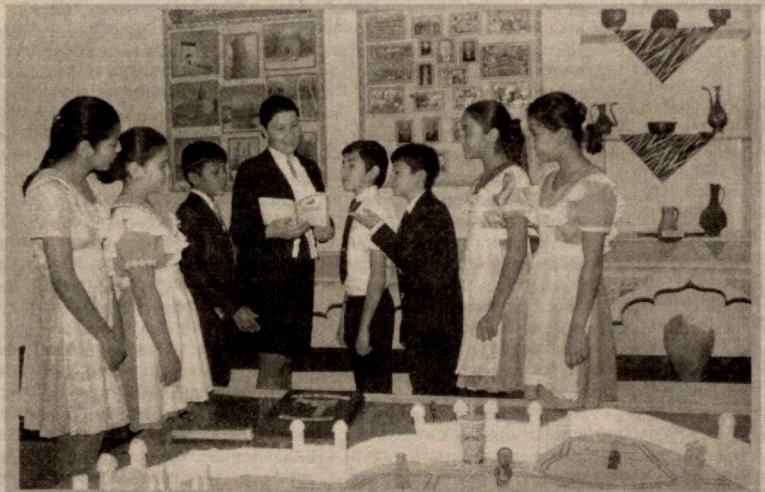
Бухоро шаҳридаги тарих фанига ихтисослашган 6-мактаб Асосий қонунимизнинг мазмун-моҳиятини ёшларга ўргатиш борасида фаол иш олиб борилаётган таълим масканларидан.

Ўзбекистон халқи кўпмиллатли эканлини инобатга олсак, давлатимизда бошқа миллат вакиллари ҳам ҳуқуқ ва эркинликлари, миллий қадрият ва урф-одатлари-