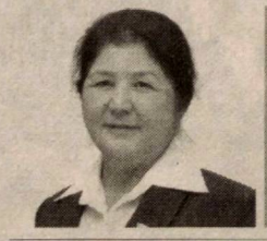
Робaxon АБДУРАСУЛОВА, Олий Мажлис Қонунчилик палатаси аъзоси, O'zLiDeP фракцияси аъзоси

Конституциямизнинг 64-моддасида «ота-оналар ўз фарзандларини вояга ет-гунларига қадар боқиб ва тарбиялашга мажбуриятлари», дея белгилаб қўйилган. Зеро, жамиятимизда ота-оналар билан болалар ўртасидаги ўзаро ҳурмат ва иззат юксак қадрланади.