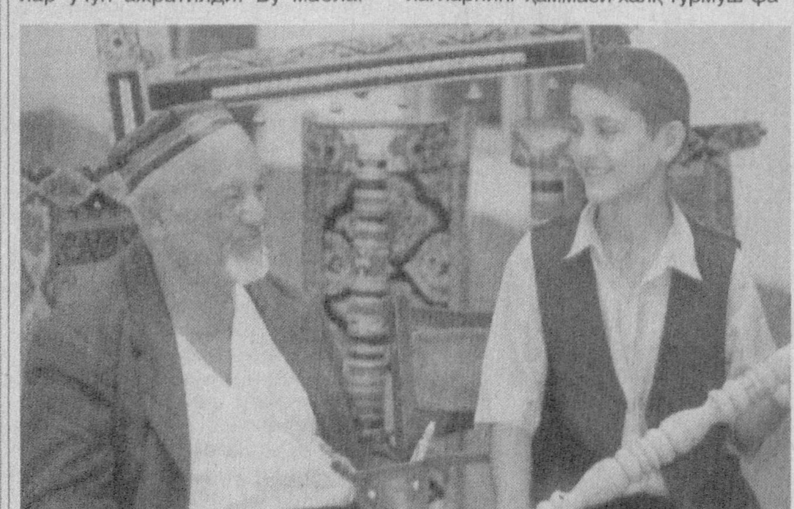
Сўнгги йилларда ўзини ўзи бошқариш органи фаолиятига катта эътибор қаратилмоқда. Бу фуқаролар йиғини фаолиятини ривожлантиришда кенг имкониятлар эшигини очиб берди. Ана шу имкониятлардан кенг фойдаланаётган Шаҳрисабз туманидаги «Тўдамайдон» фуқаролар йиғини фаолияти маҳаллаларда маънавий-маърифий ишларни ташкил этиш, табиий газ ва ичимлик сув таъминотини яхшилаш, ёрдамга муҳтож оилаларни ижтимоий ҳимоялаш каби муҳим ишларни амалга оширмоқдалар.

ларнинг ҳаммаси тармоқни ривожлантириш, бугунги кун талаб ва эҳтиёжларини ҳисобга олган ҳолда маҳсулотлар ишлаб чиқариш, янги иш ўринлари ташкил этишга сарфланмоқда. Хукуматимизнинг тadbиркорликни ривожлантиришни рағбатлантиришга оид қўшимча чора-тadbирлар тўғрисидаги қарори дастуриламал бўлгани ҳолда, тadbиркорлик субъектларига ажратилган маблағларнинг ҳаммаси халқ турмуш фа-