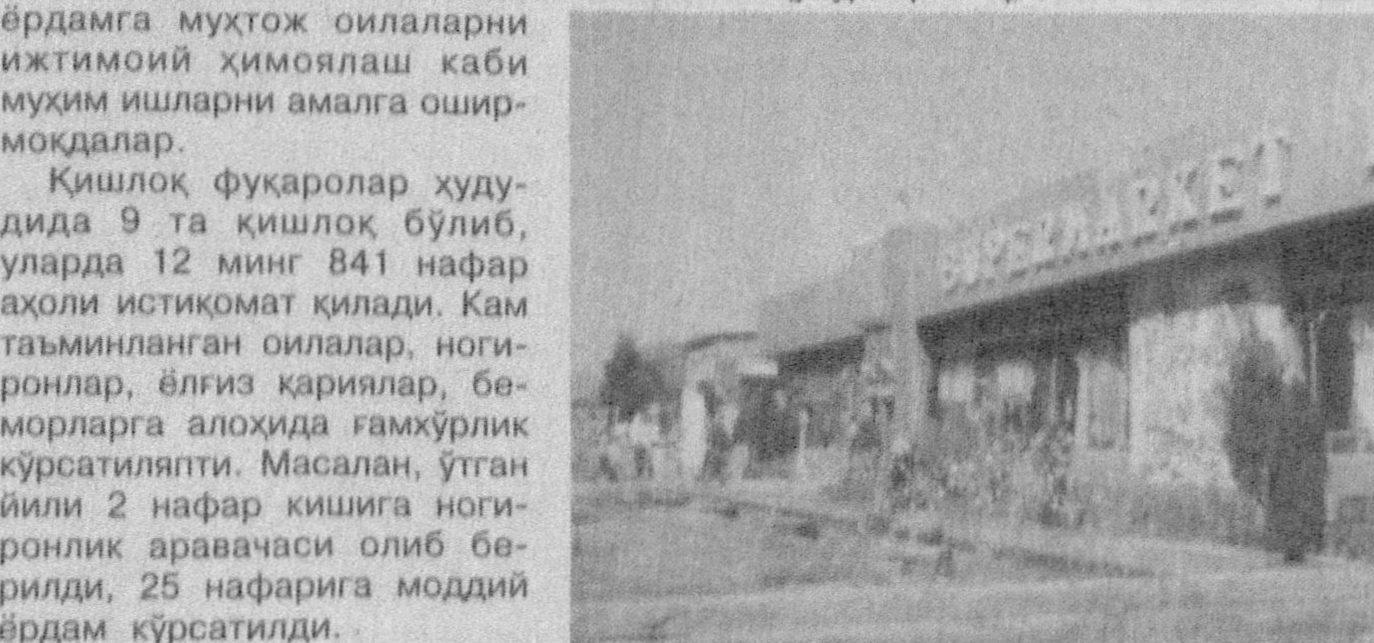
Сўнгги йилларда ўзини ўзи бошқариш органи фаолиятига катта эътибор қаратилмоқда. Бу фуқаролар йиғини фаолиятини ривожлантиришда кенг имкониятлар эшигини очиб берди. Ана шу имкониятлардан кенг фойдаланаётган Шаҳрисабз туманидаги «Тўдамайдон» фуқаролар йиғини фаолияти маҳаллаларда маънавий-маърифий ишларни ташкил этиш, табиий газ ва ичимлик сув таъминотини яхшилаш, ёрдамга муҳтож оилаларни ижтимоий ҳимоялаш каби муҳим ишларни амалга оширмоқдалар.

Қишлоқларни ободонлаштириш ҳам маҳалла фуқаролар йиғини фаолиятининг эътиборидан четда қолмапти. Хусусан, кейинги пайтда Са-