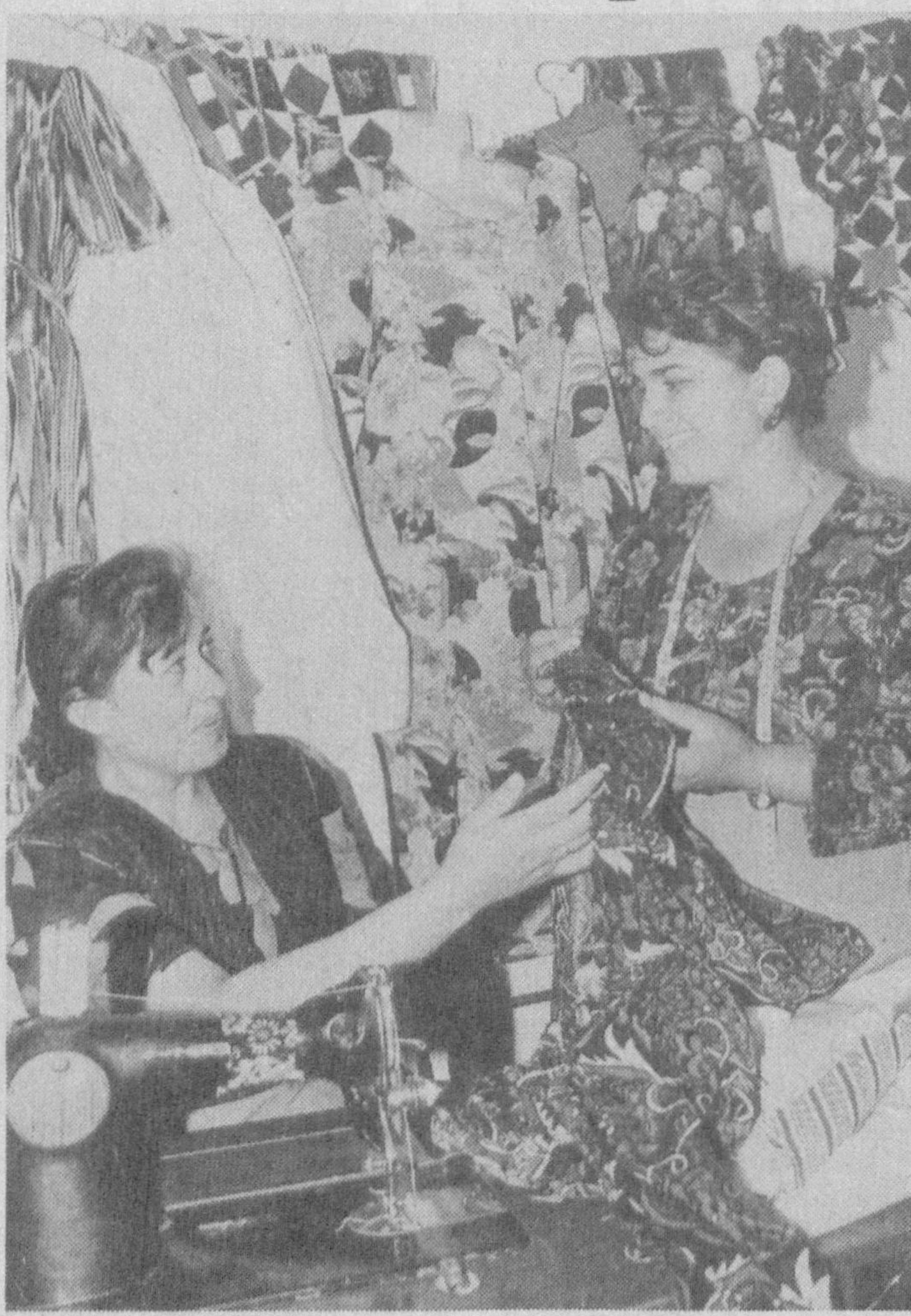
Маҳалладаги тикув цехида ишлаётган аёллар