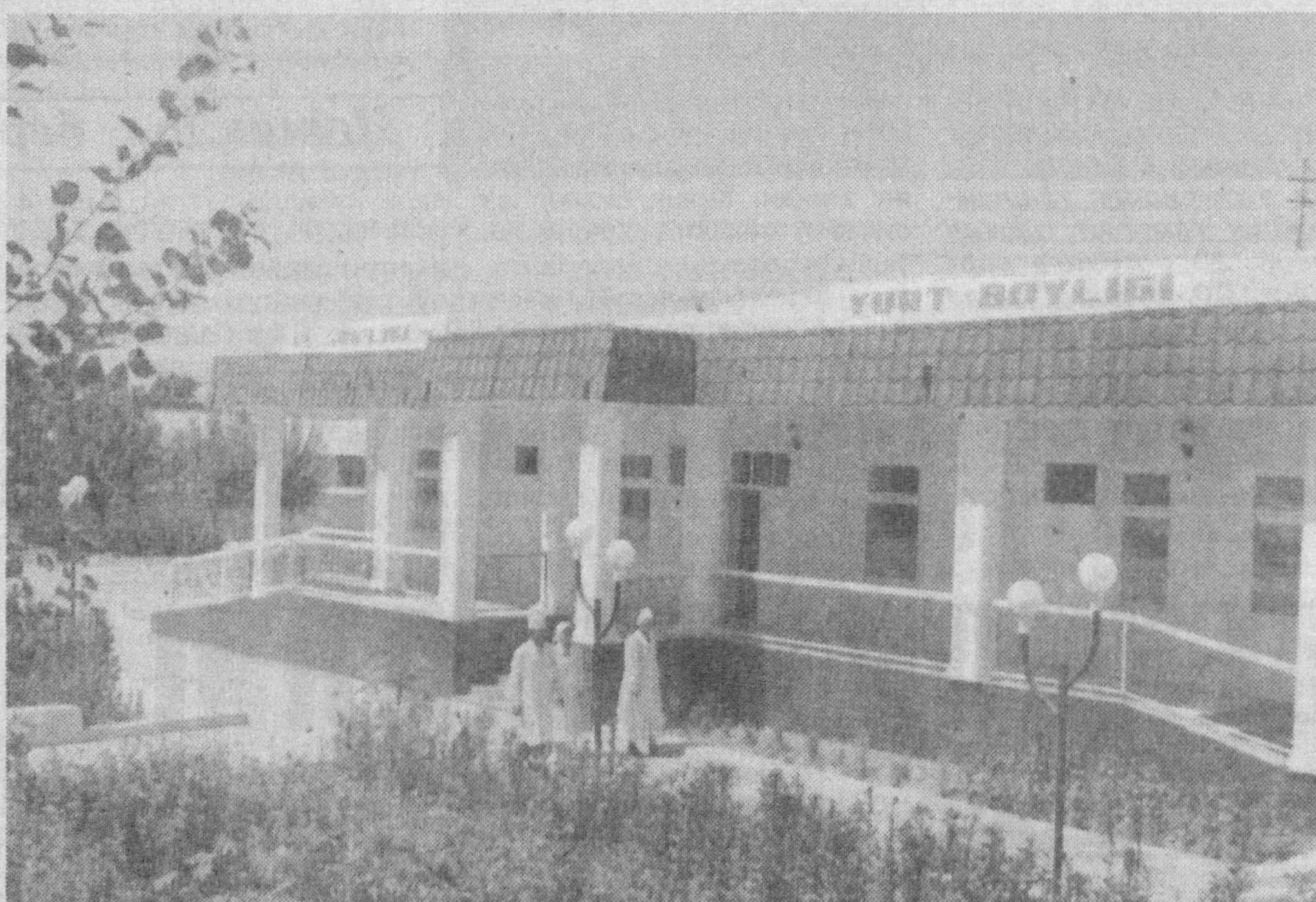
«Дурбеш» юқумли касалликлар шифохонаси бош ҳақими