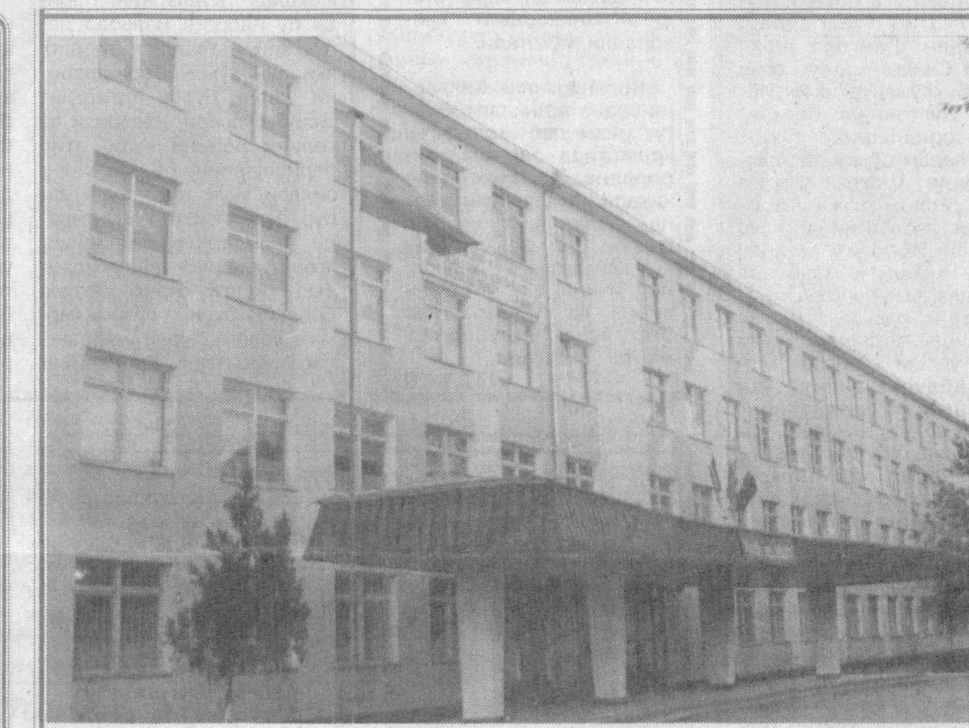
Оқолтин туманида жойлашган ижтимоий-иқтисодий коллеж кўп тармоқликка асосланган илм масканларидан бири. Утишига назар ташланса, анча узокка бориб тақалади. Дастлабки йилларда ушбу даргоҳ фақат чўл минтақаларини ўзлаштириш учун мутахассислар тайёрлаб беришга ихтисослаштирилган бўлиб, битирувчилар асосан қурилиш, сув иншоотлари ва кўрик ерларни ўзлаштириш соҳаларига йўналтирилди. Уша кезларда гарчи, илмгоҳ олдида турган максадлари сари интилган бўлса-да, миллийликка асосланган таълим кўп ўринда етишмаётганлиги яққол сезилиб турарди.

Еш авлодга ҳунар сирларини ўргатишда ва уларга етарли шароитлар яратиш бериш йўлида камарбастилик қилаётган бу жонқуяр инсон ҳақида чўлқуварлар меҳри ила гапиришди. Абдуманноп ЭҒАМОВ