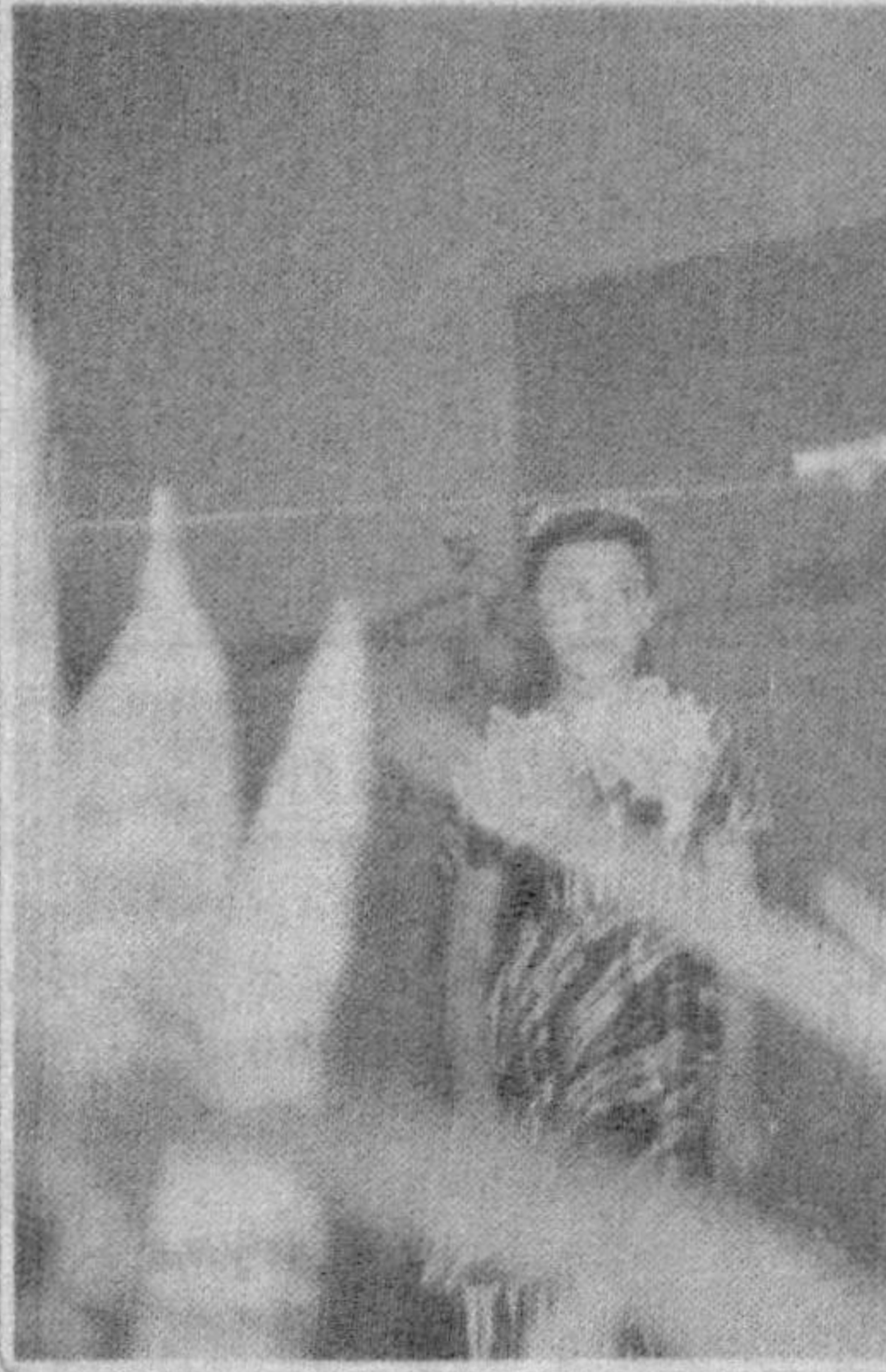
Саксон ёшни қоралаётган меҳнат фахрийси. Уруш йилларида ёшлар тарбияси билан шуғулланиб, мактаб ва маориф соҳасида етарли тажриба ортирди. 1988 йил қариллик пенсиясига чиқди. Айни пайтда Ўзбекистон Республикаси «Болалар жамғармаси» Бухоро вилоят бўлими раиси бўлиб ишлаб келимоқда. Касаба уюшмалари билан ҳамкорлик алоқалари ўрнатгани.

Талаба ва ўқувчи ёшлар меҳнат қонунчилигига риоя этилишини назорат қилиш ҳамда «Фўқароларнинг мурожаатлари тўғрисида»ги Ўзбекистон Республикаси қонунига биноан ҳар бир шикоят ва аризаларни қонуний ҳал этилишини таъминлаш бўйича муайян натижаларга эришилди. Беш йил давомида Марказий кўмитага 84 та ёзма ва 678 та оғзаки мурожаатлар тушди. Уларнинг барчаси белгиланган тартибда қўриб чиқилди ва ўз ечимини топди. Тахлиллар шунини кўрсатаяптики, кейинги пайтда ходимларнинг ҳақ-хуқуқлари ва қонуний манфаатлари иш бериувчилар томонидан қўпол равишда бузилмоқда. Шу бо-