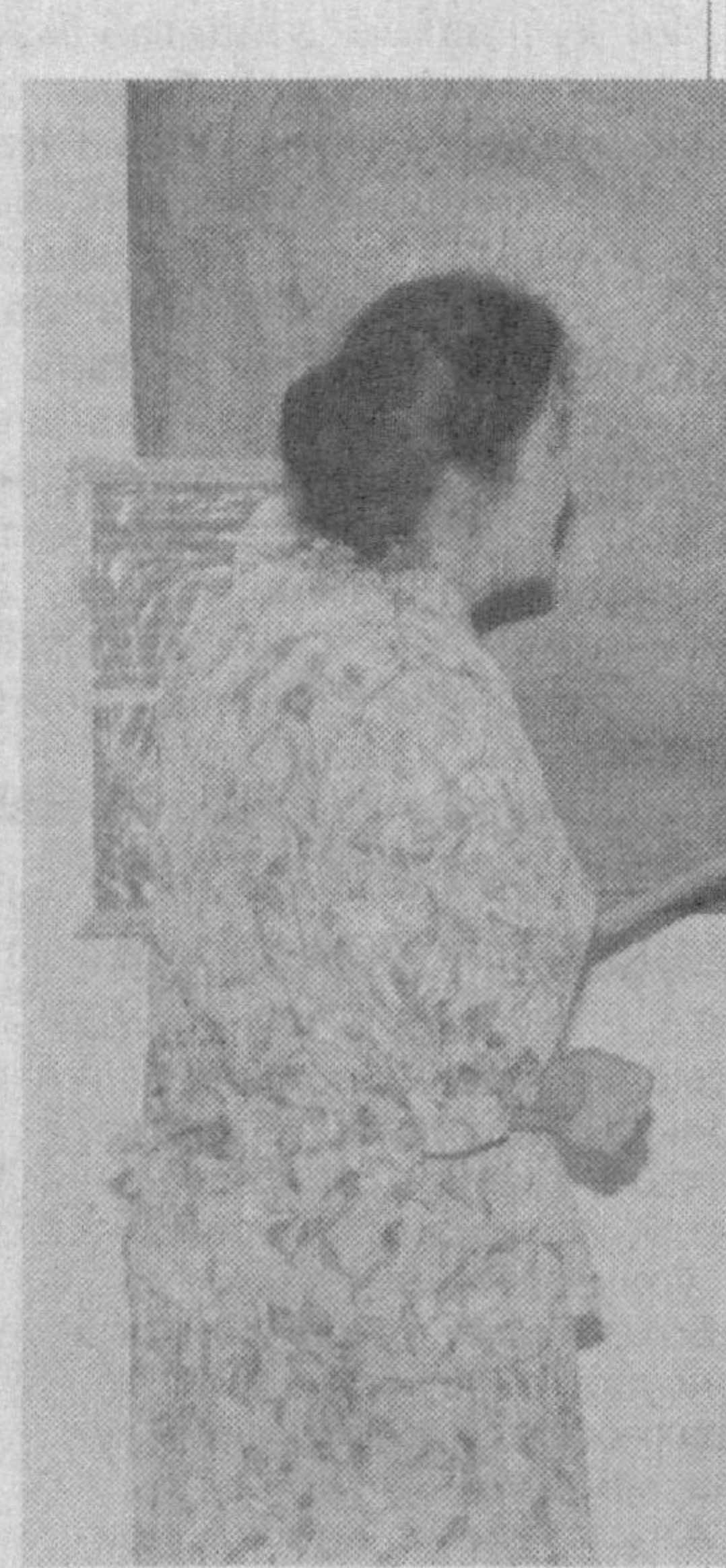
Юртимиз тарихи, буюк алломуларимиз, замонаимизнинг маърифатпарвар зиёлиларининг фаолиятларини ўрганиш орқали ёш авлодга миллий истиқлол мафкурасининг асослари кунт билан тушутирилди.

Талаба ва ўқувчи ёшлар меҳнат қонунчилигига риоя этилишини назорат қилиш ҳамда «Фўқароларнинг мурожаатлари тўғрисида»ги Ўзбекистон Республикаси қонунига биноан ҳар бир шикоят ва аризаларни қонуний ҳал этилишини таъминлаш бўйича муайян натижаларга эришилди. Беш йил давомида Марказий кўмитага 84 та ёзма ва 678 та оғзаки мурожаатлар тушди. Уларнинг барчаси белгиланган тартибда қўриб чиқилди ва ўз ечимини топди. Тахлиллар шунини кўрсатаяптики, кейинги пайтда ходимларнинг ҳақ-хуқуқлари ва қонуний манфаатлари иш бериувчилар томонидан қўпол равишда бузилмоқда. Шу бо-