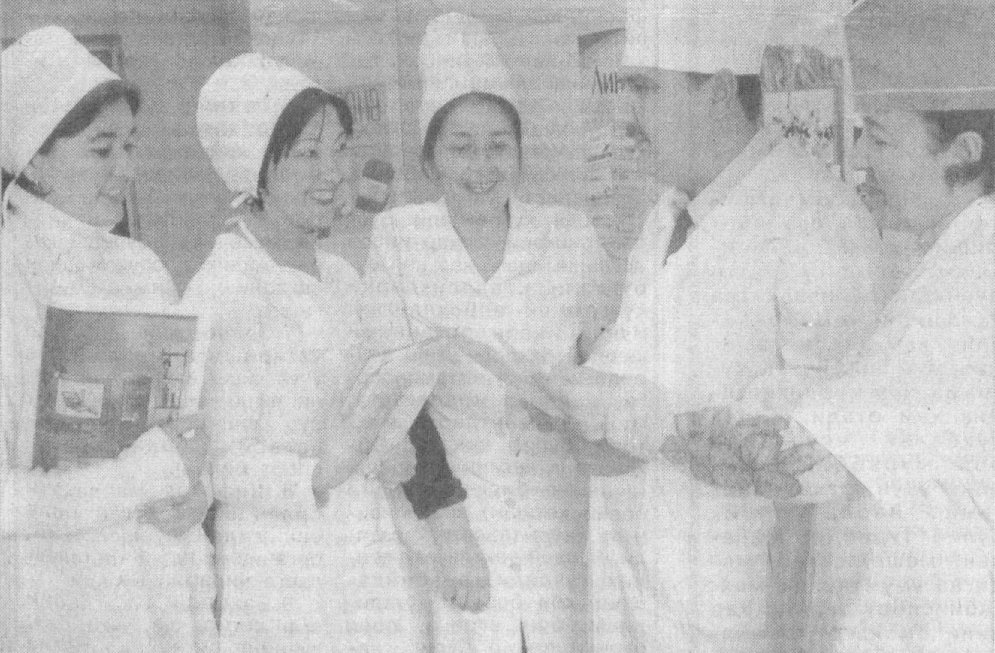
«Бухоротекс» акциядорлик жамиятига қарашли 60 ўринга муҳалланган санаторий-профилакторийда асосан ушбу қорхонада ишловчи аёллар саломатликларини тиклашади. 2004 йилда 900 дан ортиқ ишчи саломатлигини тиклаб қайтди.

Соғлом киши жамиятга кўпроқ наф қилтиради. Вилоят касабалар уюшмалари меҳнатқашларнинг соғломлаштириш йўналишида ўз дастурига эга. Шунга қўра ўтган йиллар мобайнида 9837 нафар меҳнатқашга санаторийлар йўланмаси олиб берилди.