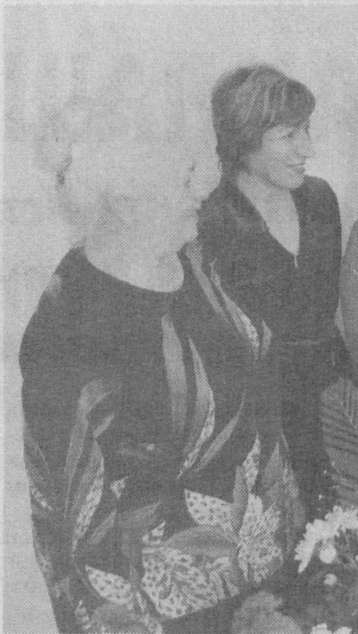
Бугунги кунда касба уюшмалари Федерацияси, шунингдек, тармоқ Марказий қўмиталари, худудий касба уюшма кенгашлари, вилоят, туман, шаҳар қўмиталари, бошланғич ташкилотларда фаолият кўрсатаётган фидойи хотин-қизларимиз мамлакатимиз ҳаётидаги ўта дол-

олиши, фарзандларини соғломлаштиришда ҳам ҳамиша ҳамжўр. Республикаимиздаги санаторий, профилакторий, дам олиш уйларида улар ўз саломатликларини тиклаш билан бир қаторда фарзандлари билан бирга дам олиш имконияти яратилган. Йўлнамаларнинг асосий қисми касба уюшмалари маблагидан қоланаётгани қувончли ҳолдир. Шунингдек, болалар оромгоҳларида ҳам уларнинг фарзандлари учун катта имтиёзлар яратилган.