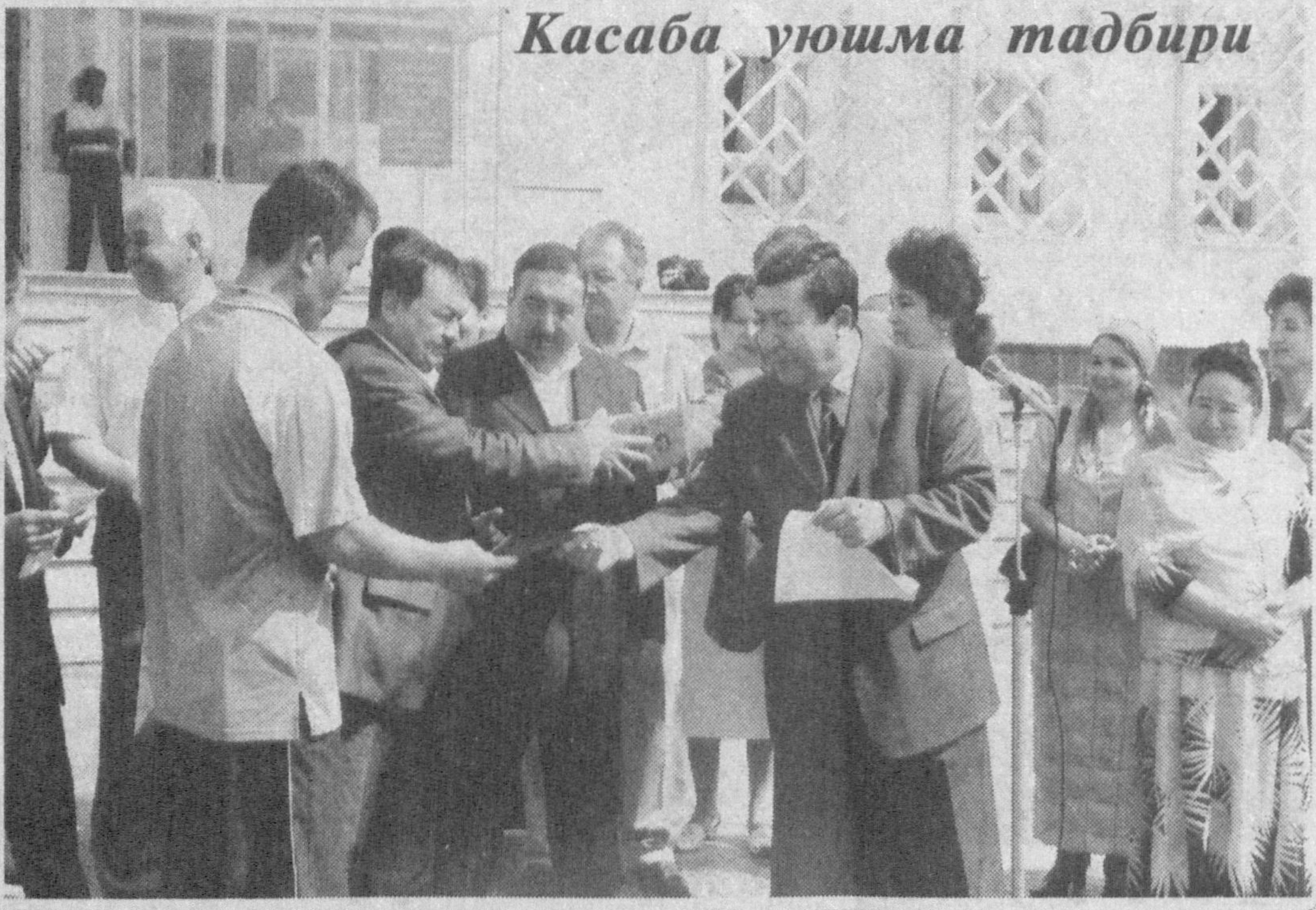
Касаба уюшма тадбири