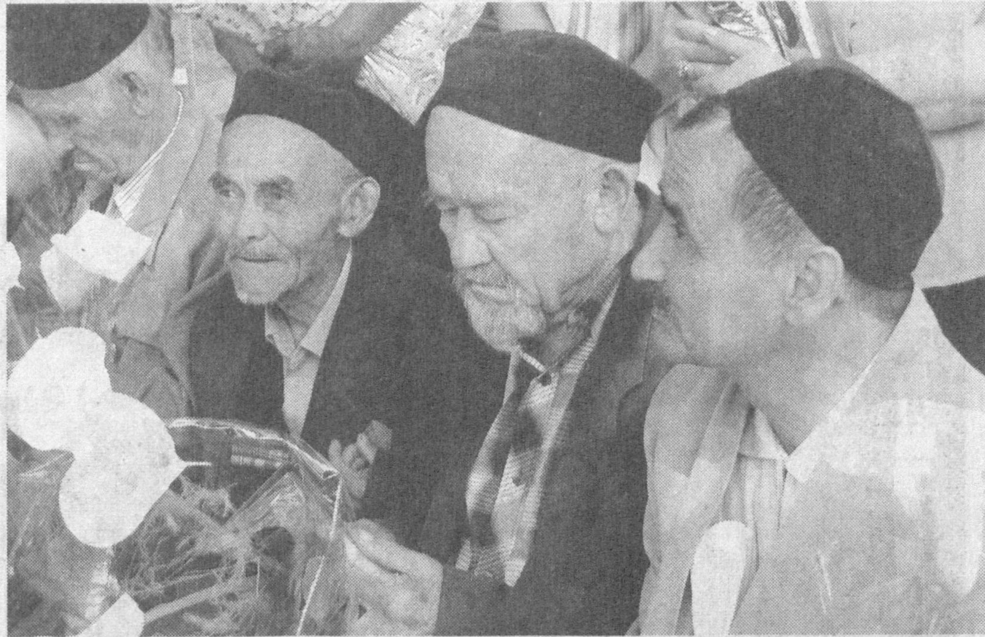
Инсон қадри улуг, инсон хотираси - муқаддас