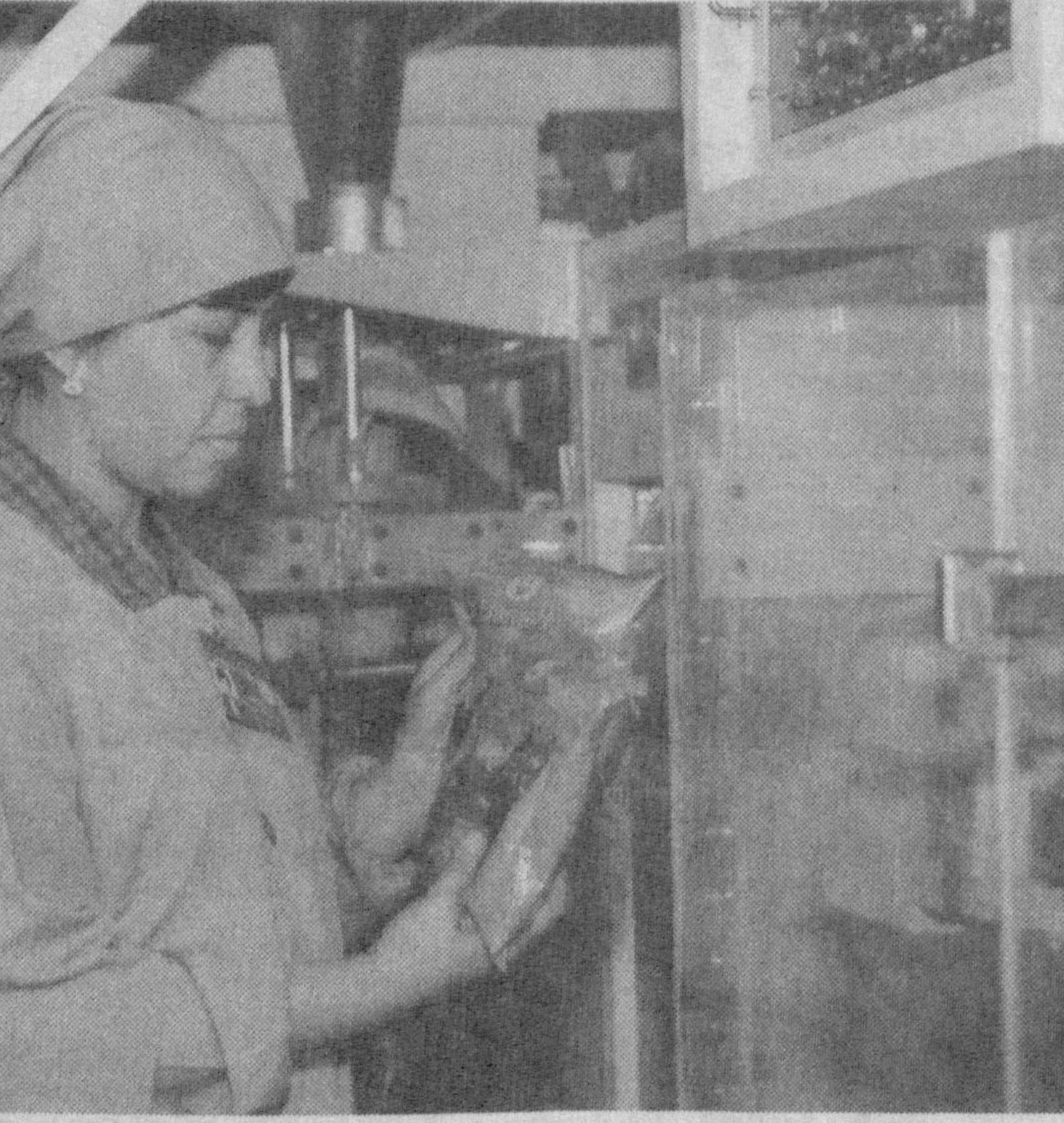
Жорий йил охирида эса биринчи республика кимосида савдосини ўтказиш режалаштирилган.

Ф. Абзаловнинг таъкидлашича, ҳозирги пайтда соҳада йилга бир ярим миллион дoна қоракўл тери тайёрлаш имконияти мавжуд. "Ўзбек қоракўли" компаниясининг олтиншита хўжалиги ўз маҳсулотлари билан қатнашиб туради. Бир вақтинг ўзида бу ерда Ўзбекистоннинг турли худудларидан келтирилган 230 миңга тегири-ни намойиш қилиш имкони мавжуд.