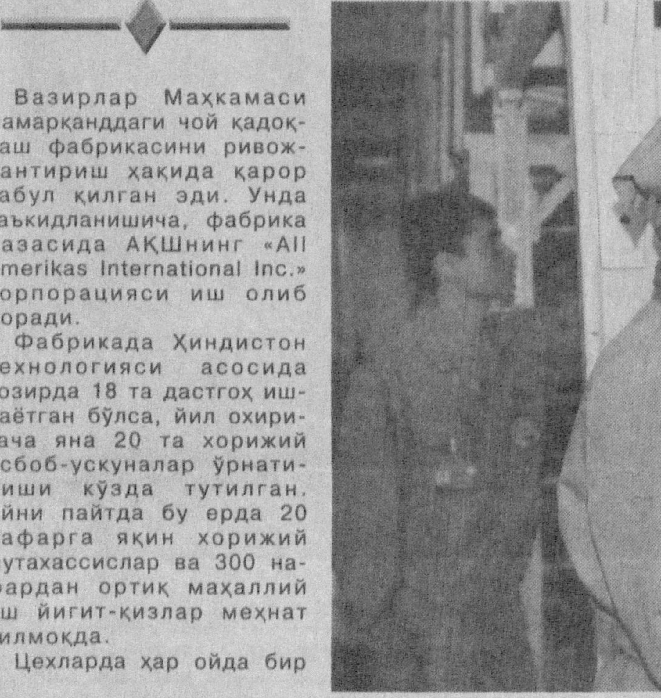
Вазирлар Маҳкамаси Самарқанддаги чой қадоқлаш фабрикасини ривожлантириш ҳақида қарор қабул қилган эди. Унда таъкидланишича, фабрика базасида АКШнинг «All Amerikas International Inc.» корпорацияси иш олиб боради.

Бу йил вилоят галлакорларининг шашти хар йилгидан кўра баланд. Ўрим-йигининг биринчи кунийк 46 та фермер хўжалиги шартнома режасини бажарди. Айни кунларда вилоят галлазорларида икки юздан зиёд дон ўриш қомбайни ишлатилляпти. Айниқса, Пахтакор, Арнасай, Дўстлик, Мирзачўл туманларида ўрим-йигини уюшқоқлик билан олиб борилмоқда.