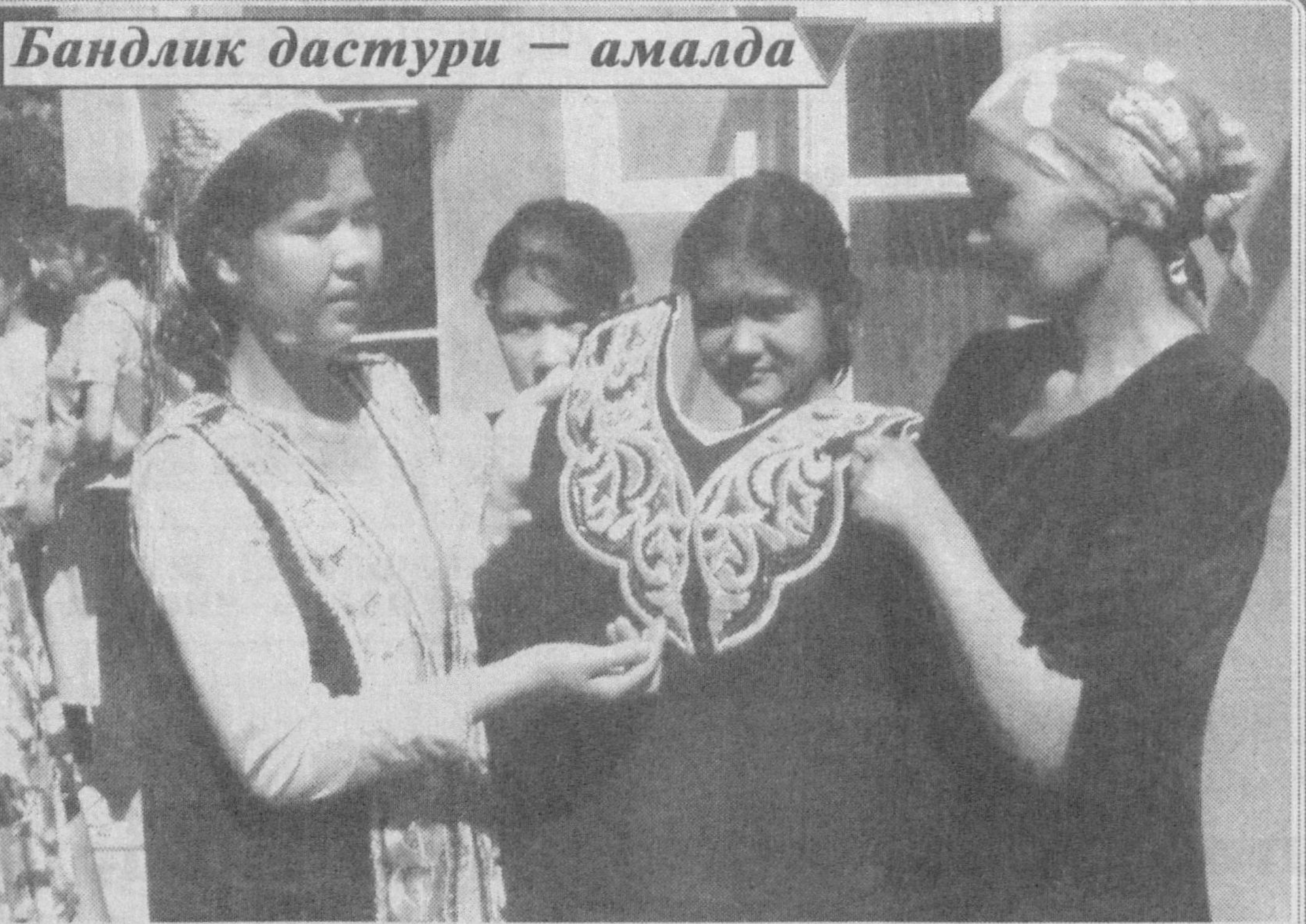
Аҳолини иш билан таъминлаш дастури асосида Шаҳрисабз туманида ижобий ишлар амалда оширилмоқда. 279 минг нафардан ортиқ аҳоли истиқомат қилаётган туманда кўшимча иш ўринлари яратилиш, меҳнатга лаёқатлиларни иш билан таъминлаш яхши йўлга қўйилган.