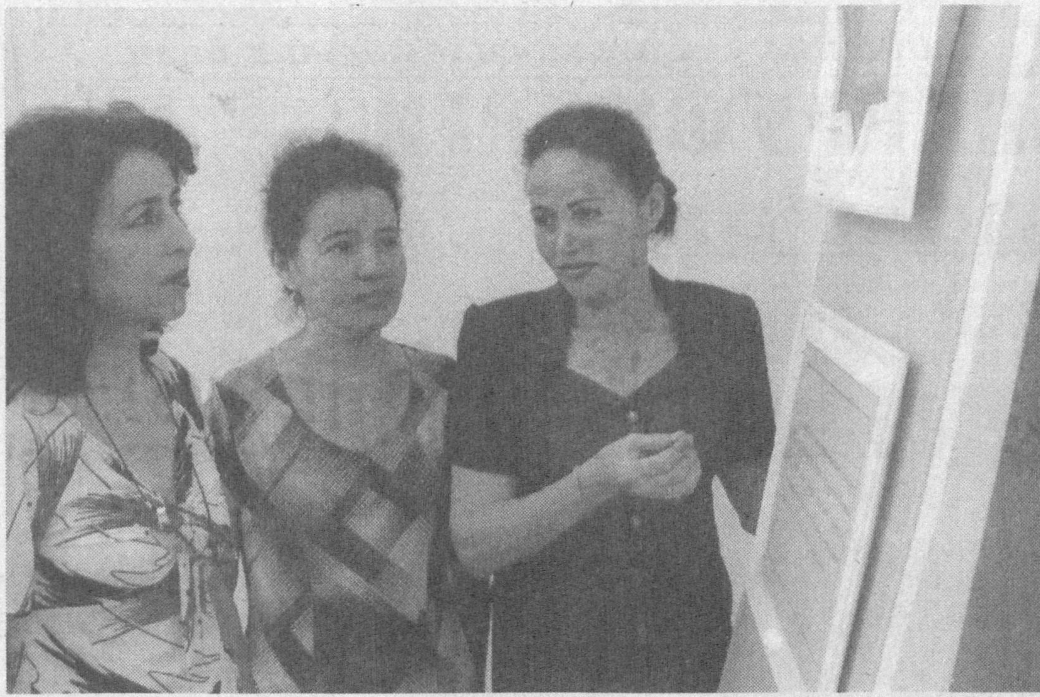
ЎЗКУФК ўқув марказида коммунал-маиший хизмат енгил, мебел саноати ва ходимлари касабга уюшма