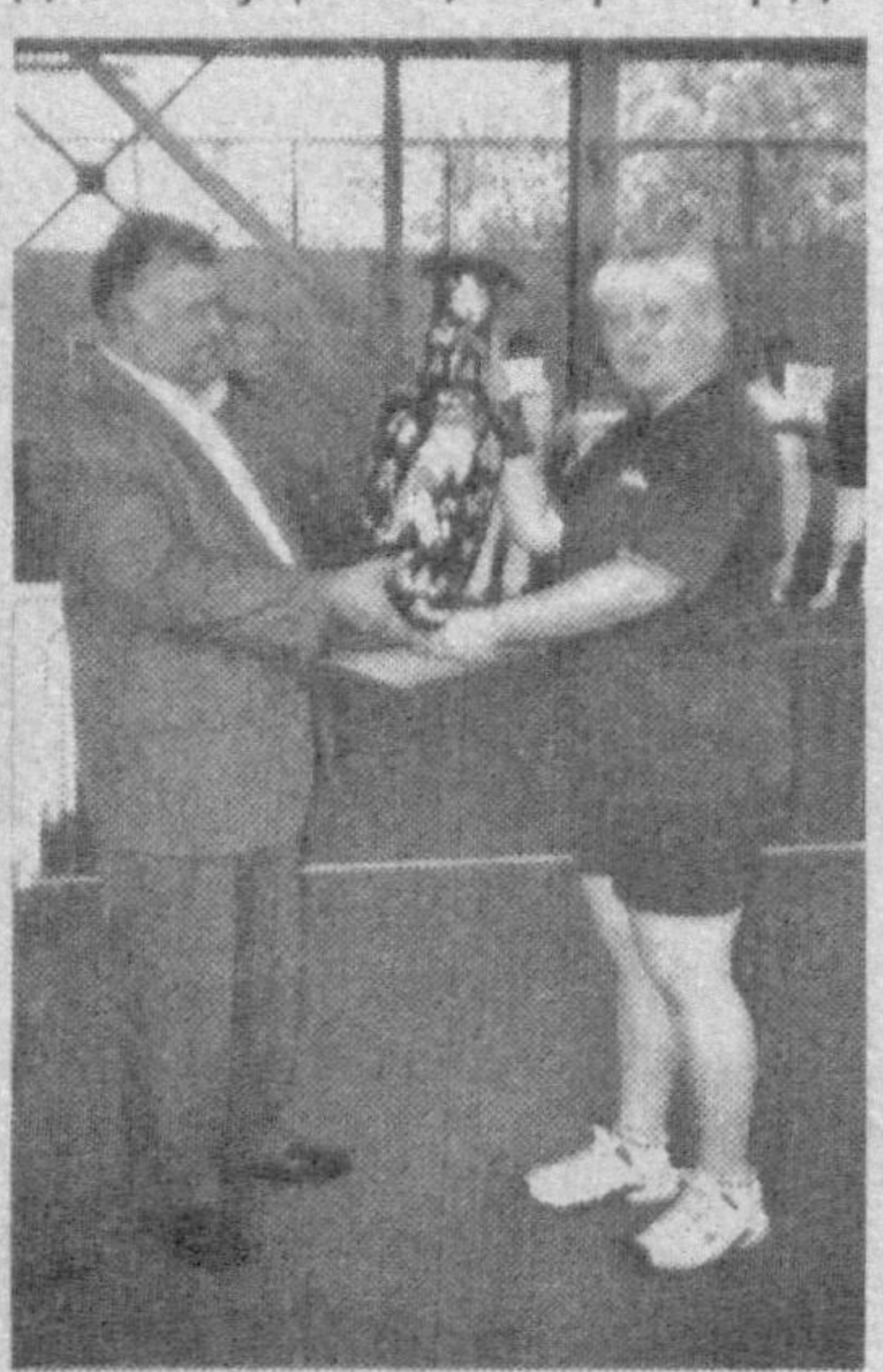
Куч синашган меҳнаткашларнинг ҳар бир ўйини, улар кўрсатган ажойиб

нис турнирида ҳам ким қайси ўринни эгаллашдан қатъий назар дўстлик, ҳамжихатлик галаба қилди. Мухими, кортларда