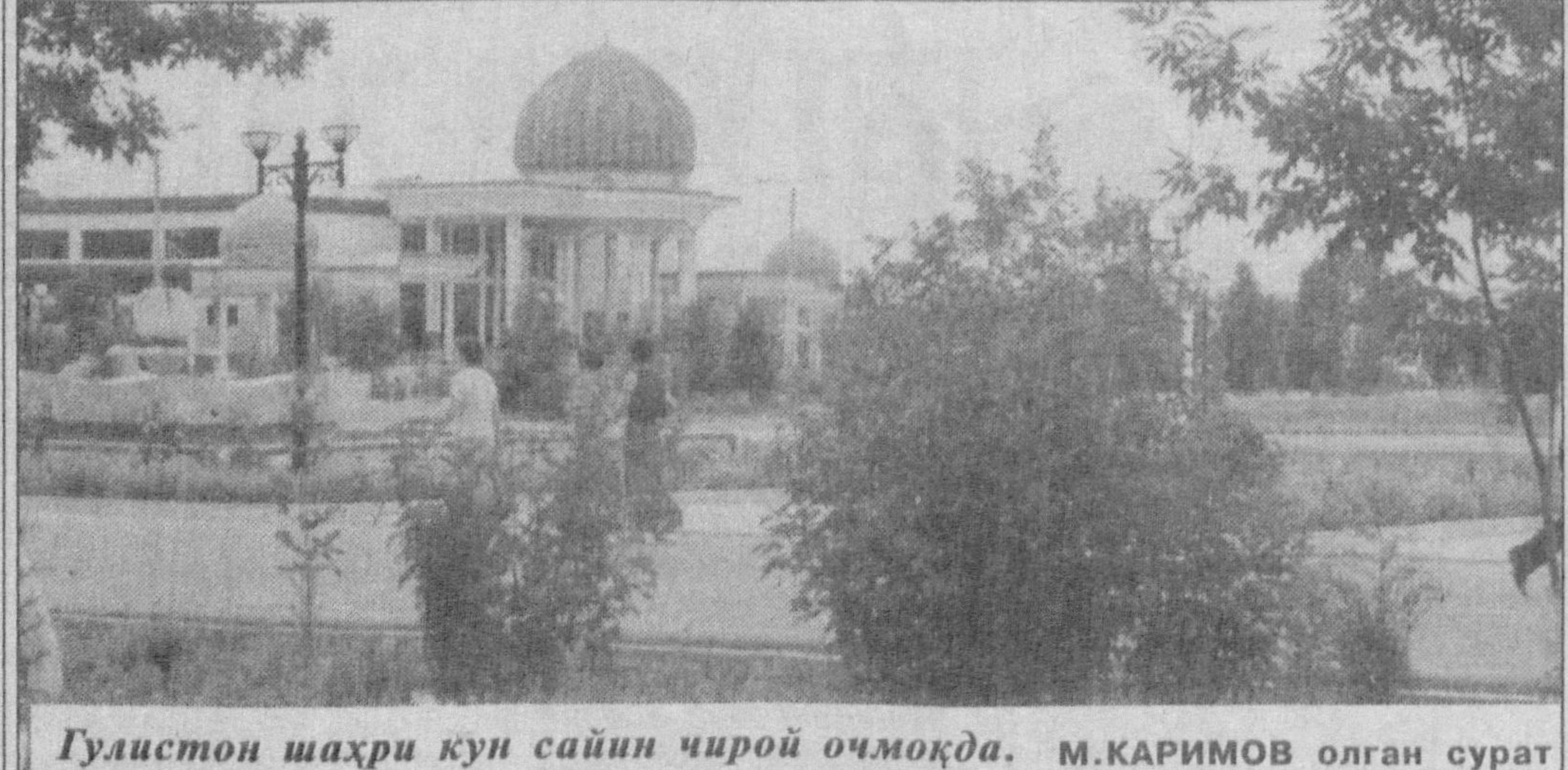
Гулистон шаҳри кун сайин чирой очмоқда.

Катта ҳаёт йўлини босиб ўтган, ўзининг савобли ишлари билан юртдошлари хўрматини қозонган ёшунини нафақат Қорақалпоғистонда, балки бутун мамлакатда яхши билишди. Кекса деҳқон раҳбарлик қилаётган «Саховат» фермер хўжалиги жамоаси 30 гектарлик боғ барпо этиб, унда етиш-