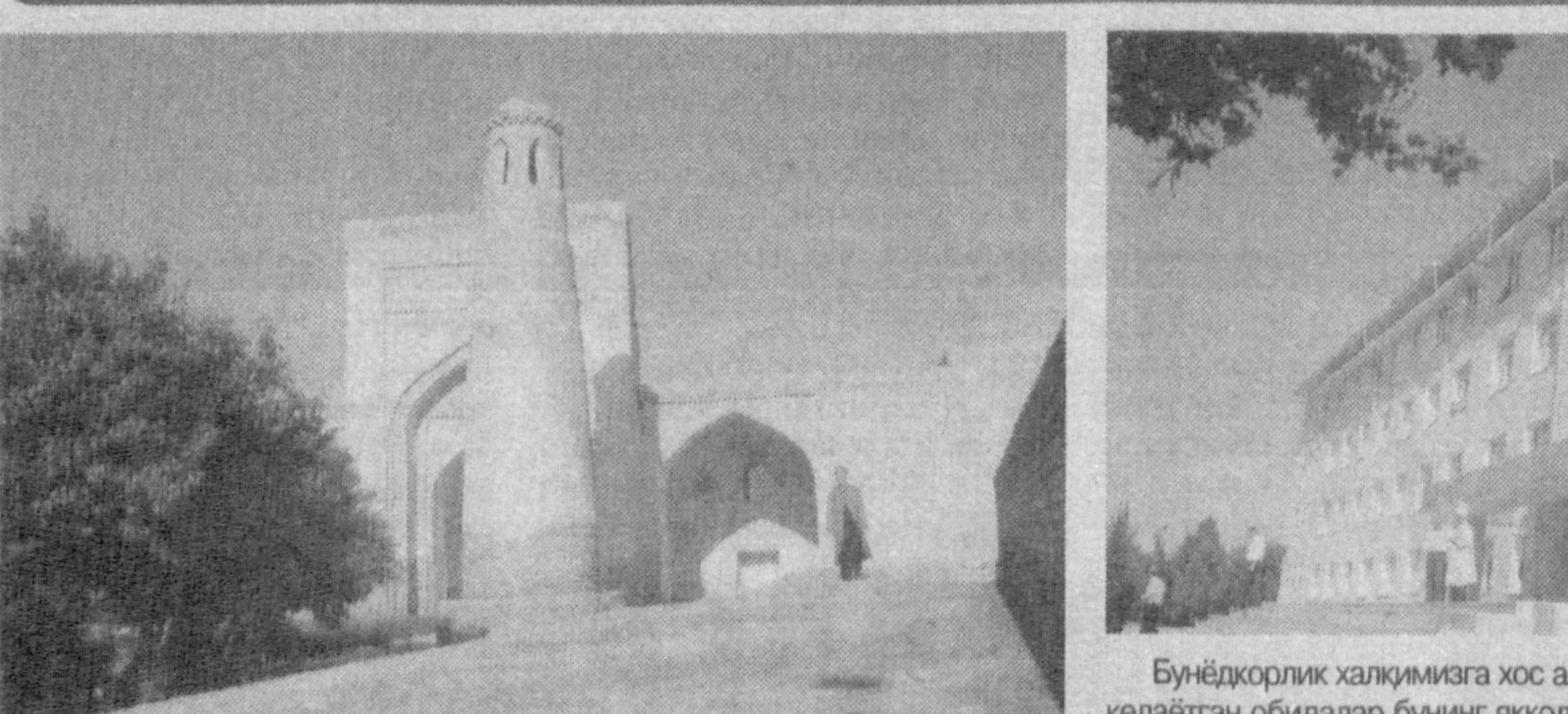
Бунёдкорлик халқимизга хос азалий фазилат саналади. Арслар оша яшаб келаётган обидлар бунинг яққол исботи.

Айниқса оналик ва болаликни муҳофаза қилиш, она ва бола соғлигини мустаҳкамлаш, репродуктив саломатлиқни яхшилаш ва оилада турмуш тарзини соғломлаштириш бўйича бир қанча лойиҳалар ишлаб чиқилиб, кенг тарғиб этилмоқда.