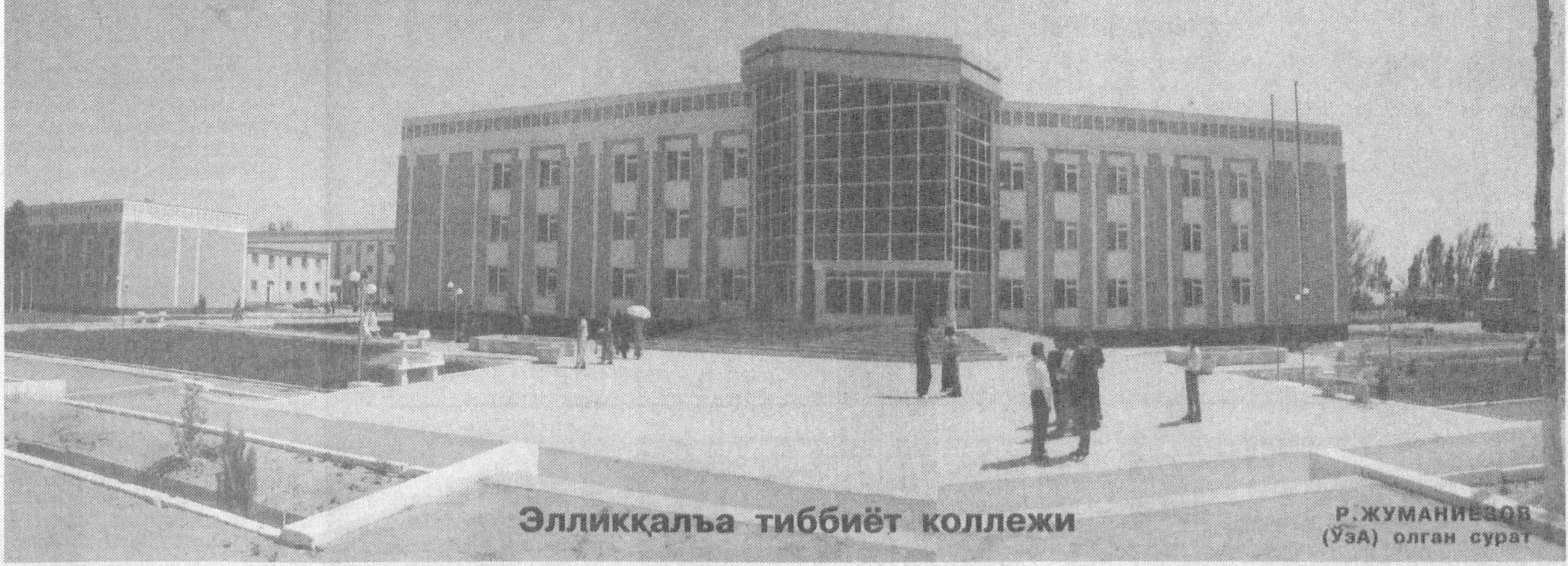
Эллиққалъа тиббиёт коллежи

Р. ФАРМОНОВ («Халқ сўзи», 2005 йил, 22 июн)