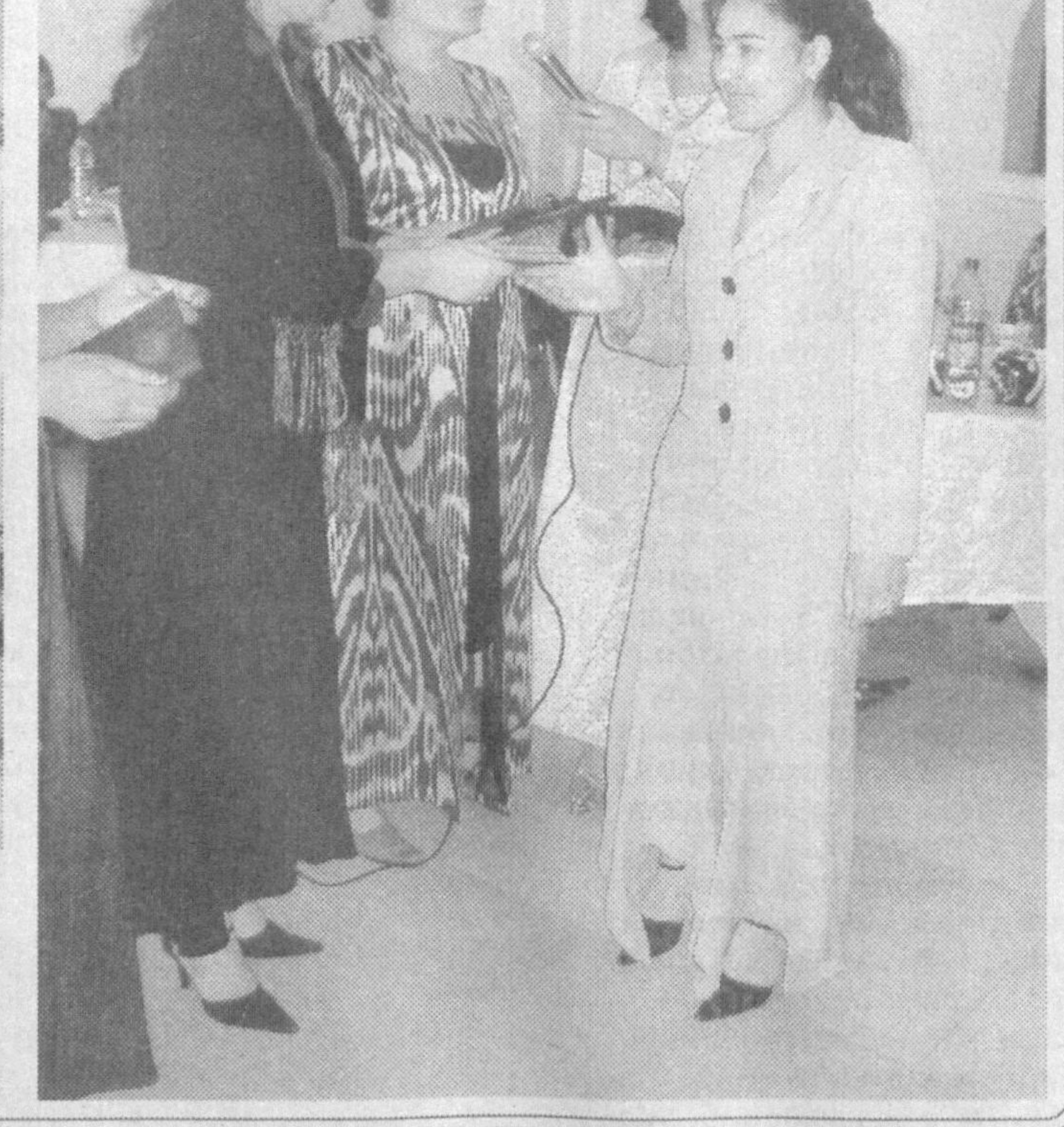
тиқиш бўйича махсус гувоҳ-нома олди. Келажакда ушбу фирма ўз имкониятларини кенгай-тира бориб пазандачилик ва сартарошлик бўйича ўқув курсларини ташкил этишни