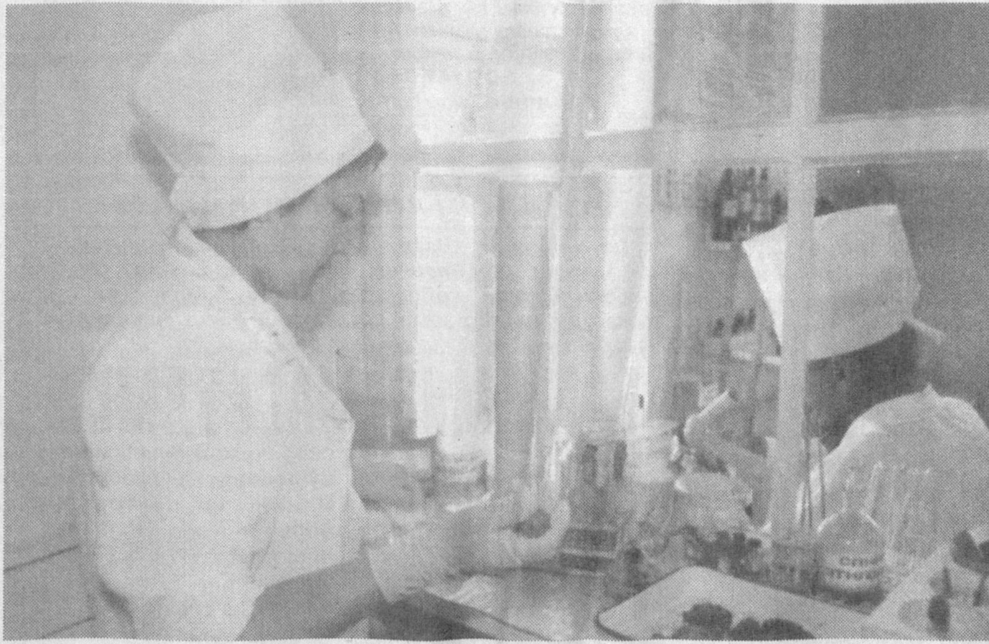
Шифохонада шифокор билан беморнинг суҳбатлари.

"Телиминг" ҚВПси 8 минг нафар аҳолига хизмат кўрсатади. Бир кунда 75 беморни қабул қилиши мумкин бўлган мазкур шифо маскани барча касалларга биринчи тиббий ёрдам кўрсатади.