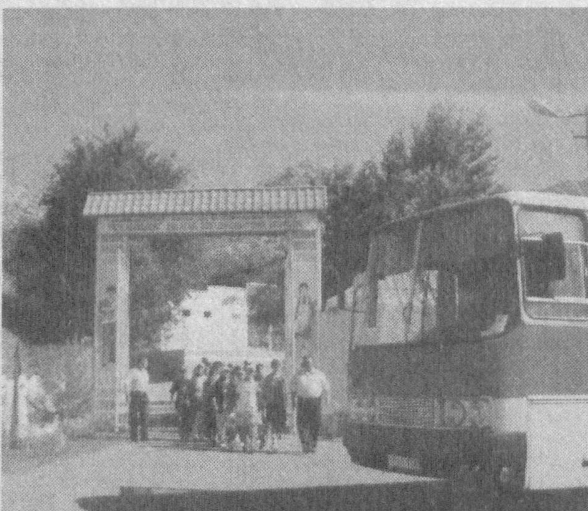
Суратларда: «Ёш алангачи», «Лочин» оромгоҳлари ҳаётинда лавҳалар.

Болаларнинг ёзи таълини кўнгилли ўтказишда Қашқадарё вилоятидаги кўплаб оромгоҳлар муносиб фаолият кўрсатмоқда. Муборак газ конлари бошқармасига қарашли «Ёш алангачи» оромгоҳида ҳар босқичда 450 нафар ўғил-қиз марокли хордиқ чиқармоқда. Гўзал табиат кўйида жойлашган дам олиш масканида болалар яйраб ором олишляпти. Айниқса, бу ерда ташкил этилаётган турли спорт мусобақалари ёш авлоднинг жисмонан чиниқишига хизмат қилмоқда. «Лочин» оромгоҳи ҳам ўқувчиларнинг севимли масканига айланган. Оромгоҳ ҳозирги босқичда Қамаша шаҳридаги Меҳрибонлик уйининг 32 нафар тарбияланувчисини ўз қўчоғига олди.