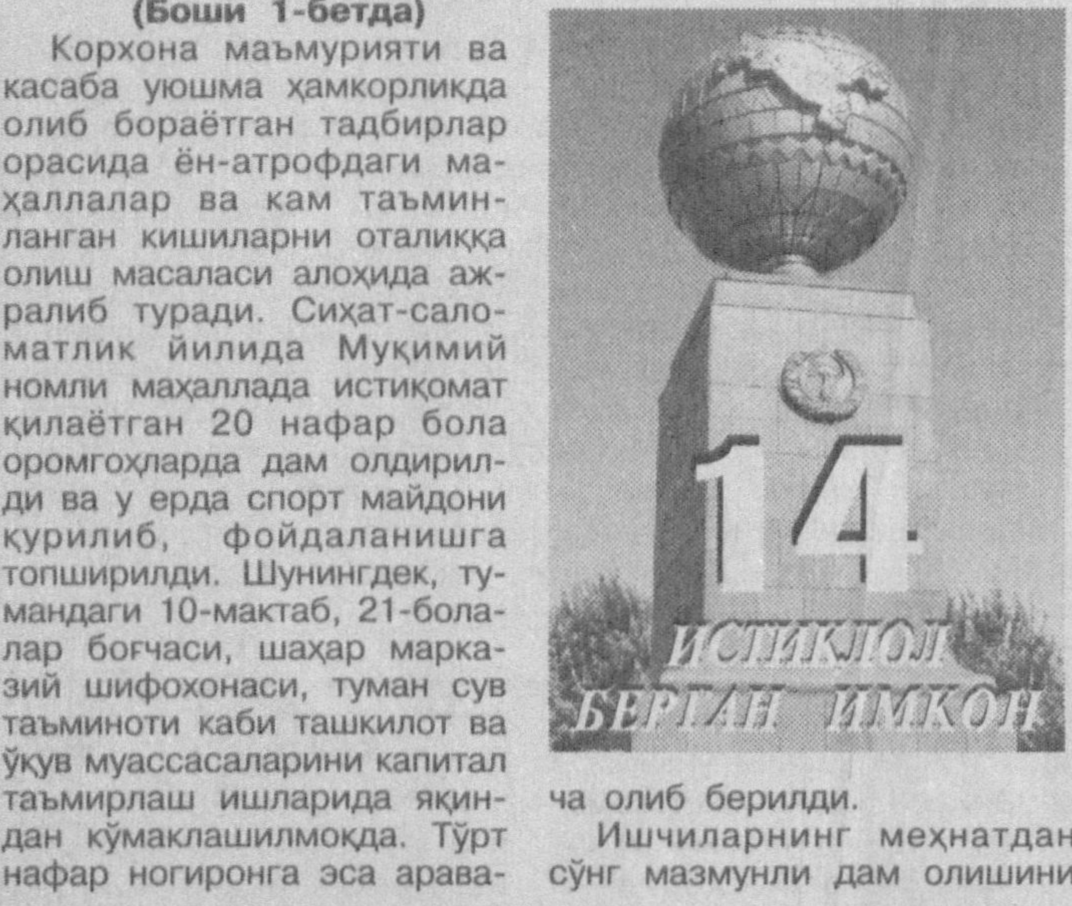
ИСТИҚЛОТ БЕРГАН ИМКОН

ча олиб берилди. Ишчиларнинг меҳнатдан сўнг мазмунли дам олишини