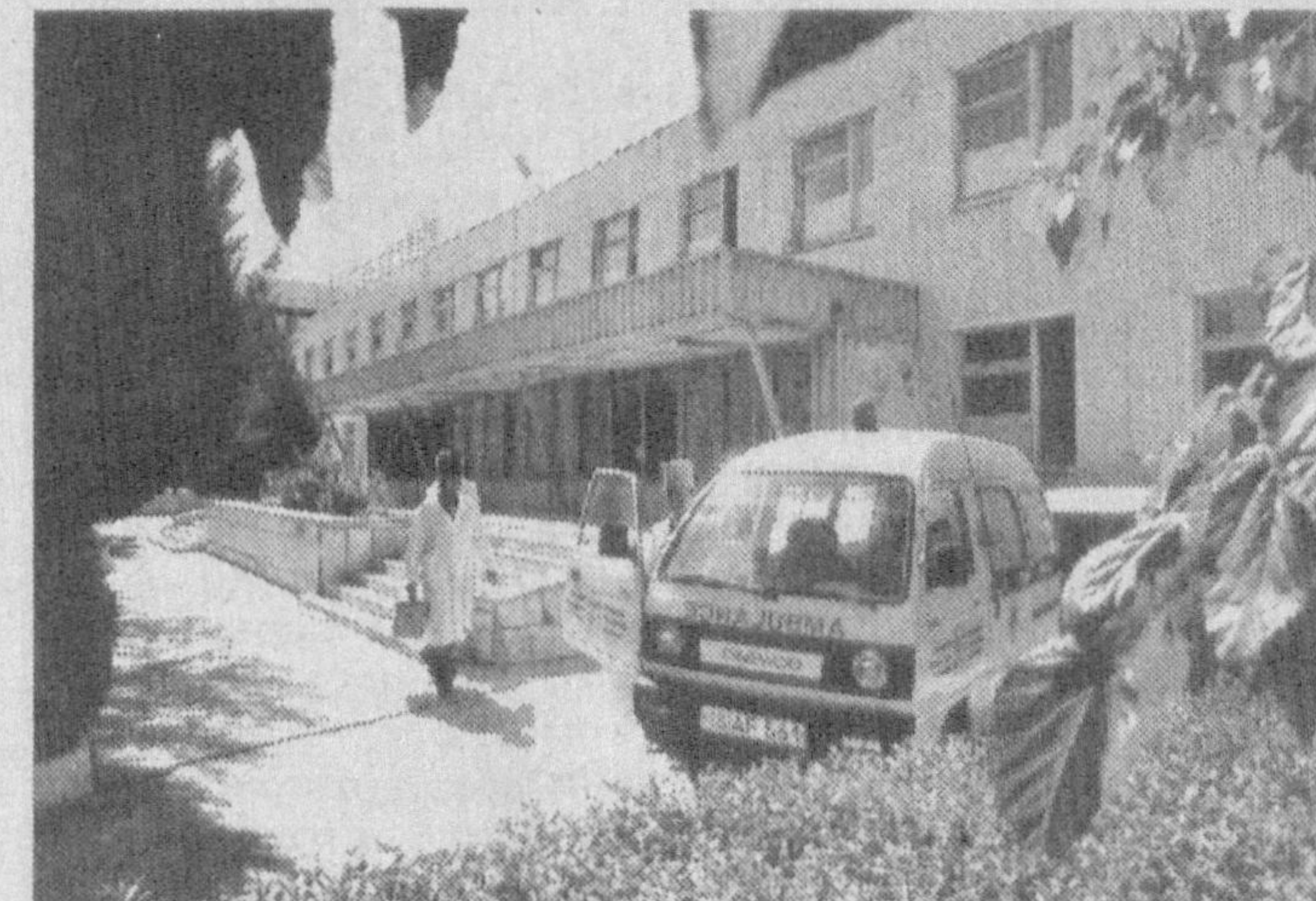
У ҳар соатда 800 минг киловатт электр энергияси ишлаб чиқариш қувватига эга. Станцияда ишлаб чиқарилаётган электр энергиясини маълум қисмини яқин орада қўшни мамлакатларга экспорт қилиш ҳам кўзда тутилмоқда. Улкан курилиш ишларида кўплаб хориж мамлакатларида тайёрланган ускуналар ишлатилди. Шунингдек, хорижлик ишчилар ҳам бунёдкорлик ишларида ақиндан ёрдам бердилар. Суратларда: Нуристон шаҳрининг бугунги кўринишлари.

ҳақиқий эмас деб топиш ва мерос олиш ҳуқуқи ҳамда мерос қолдирувчининг қарзларини мерос ҳисобидан ундириш тўғрисидаги даъволари билан мурожаат қилишга ҳақлидирлар. Мерос қонунчилиги бўйича мерос талаб қилиш учун муддат татбиқ этилмайди. Судлар томонидан бу тоифа ишлар кўрилишида авваламбор мерос низои субъекти бўйича тақдим қилиниши лозим бўлган ҳужжатларнинг мукамаллиги аниқлашиши, ақс ҳолда эса уларни судлар томонидан талаб қилиб олиш чораларининг кўрилиши шарт. Шунингдек, судлар томонидан мерос мулкдан меросхўрларнинг улушини белгилашда фозис ҳисобидан эмас, балки қисим-улушларда ҳисоблашлари лозим. Алқисса, мерос билан боғлиқ низоларни ҳар тарафлама тўлиқ, ҳолисона ва синчковлик билан кўриб, амалдаги қонун талаблари доирасида қабул қилинган қарорларга адолатли ва тўғри ҳисобланади.