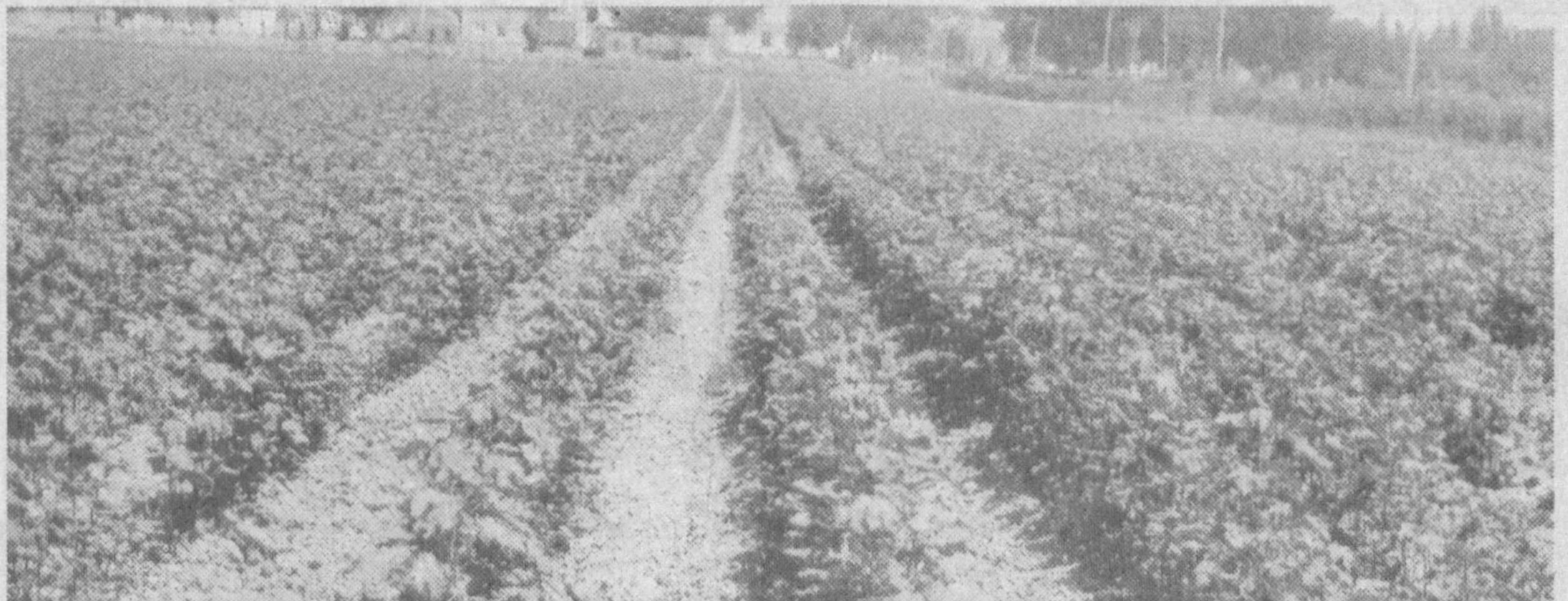
Куйи Чирчиқ туманидаги Мирзо Улугбек номли ширкат хўжалиги аъзолари эрта баҳорда 500 гектар майдонга серхосил с-6524 навли уруғ экишганди. Айни пайтда хўжалиқнинг мавжуд пахта майдонларидаги гўзалар киши кўзини қувнатади. Боиси, барча агротехник тадбирларнинг ўз вақтида ва сифатли қилиб бажарилганлиги гўзаларнинг тез ва барвақт ривожланишини таъминлади. Гектаридан 25-30 центнердан ҳосил кўтаришни кўзлаётган деҳқонлар айни пайтда чеканка ишларини бошлаб юбордилар.