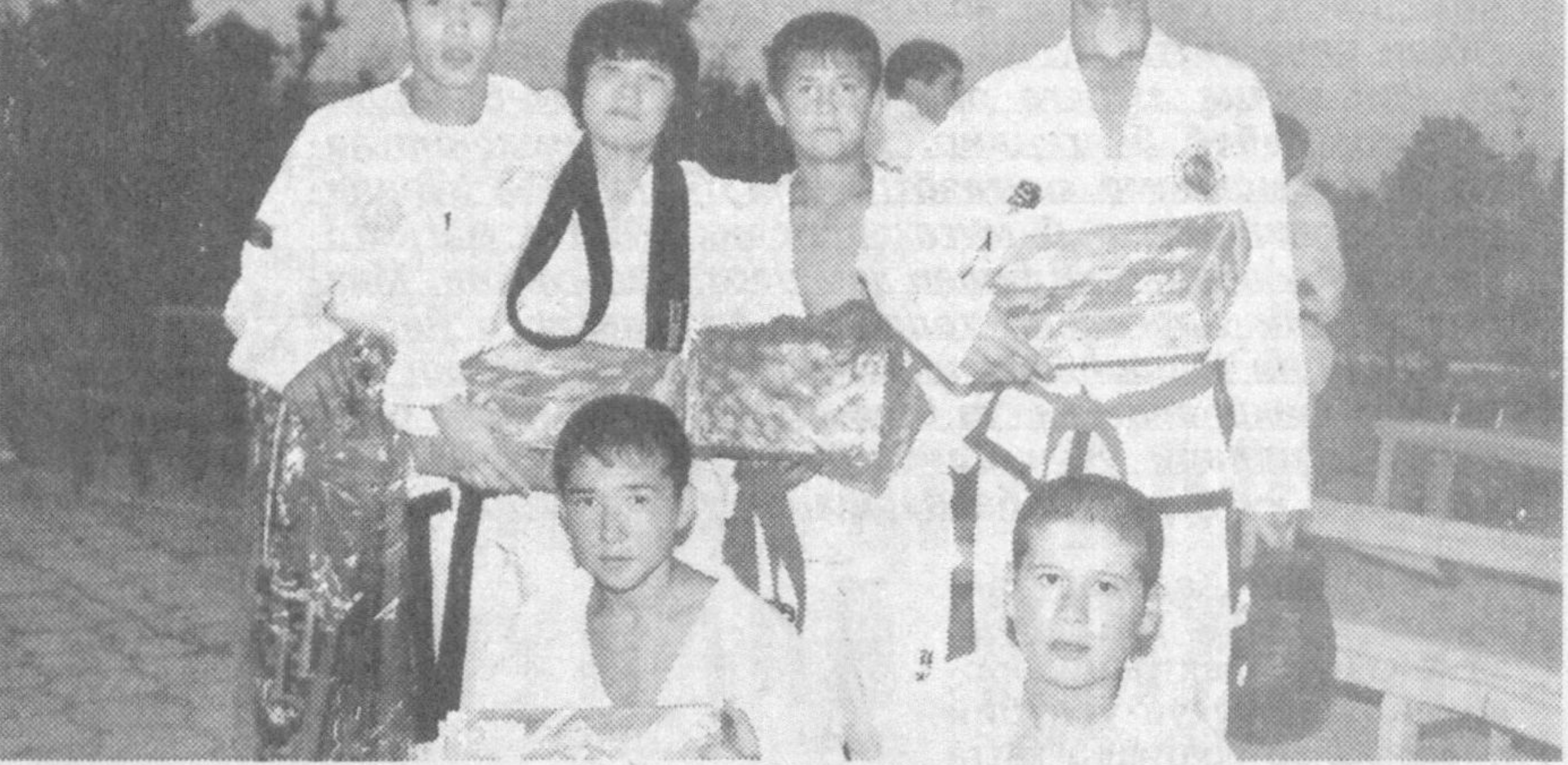
Қизғин давом этган мусобақада умумжамоа ҳисобида мезбонлар биринчи, Тошкент вилояти иккинчи, Бухоро вилояти фахрли 3-ўринни эгаллашди. Тадбир давомида шу кун бўлиб ўтган таъжвондо бўйича очик республика чемпиони финал босқичи тақдирлаш маросими ҳам бўлиб ўтди.