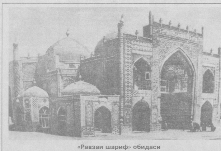
«Равзаи шариф» обидаси

Подшоҳий қаз жабинаш тоғий нури олоҳ, Он Заҳируддин Мухаммад бўд Бобур подшоҳ. Шунингдек, Бобурушод боғида Шоҳжаҳон томонидан уни-нинг ҳарбий галабаси муносабати билан оқ мармар тошларидан қурилган чиройли масжид диққатни ўзига тортиб туради. Масжиднинг барча томонлари тағидан тепасига-га бир хил нафис оқ мармар тошдан қурилган бўлиб,