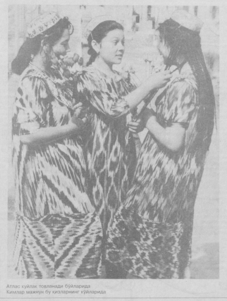
Атлас куйлак товланади бўйлариде Кимлар маънун бу қизларнинг куйлариде