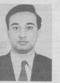
Яқинда бизнинг ёш давлатимиз мустақиллигининг 5 йиллигини тантанали равишда нишонлади.

Кискача фурсат ўтганига қарамастан Республикаимиз ҳуқуқий давлатлар қуриш йўлида каттагина қадамлар ташлади. Биз бунга АҚШнинг амалда қўлланайётган ҳуқуқ тизими, ҳуқуқий соҳадаги илоҳотлари билан танишган, янада ишонч ҳосил қилдик. Американинг Ҳалқаро ривожланиш ташкилати ҳамда Ўзбекистон республикаси Президентини қўшидаги давлат ва жамият қурилиш академияси билан ҳамкорликда бир ойлик амалиёт ташкил қилинган ва биз — суд ва прокуратура ходимлари уни Америка Қўшма Штатларида ўтдик. Шу давр давомида америкалик