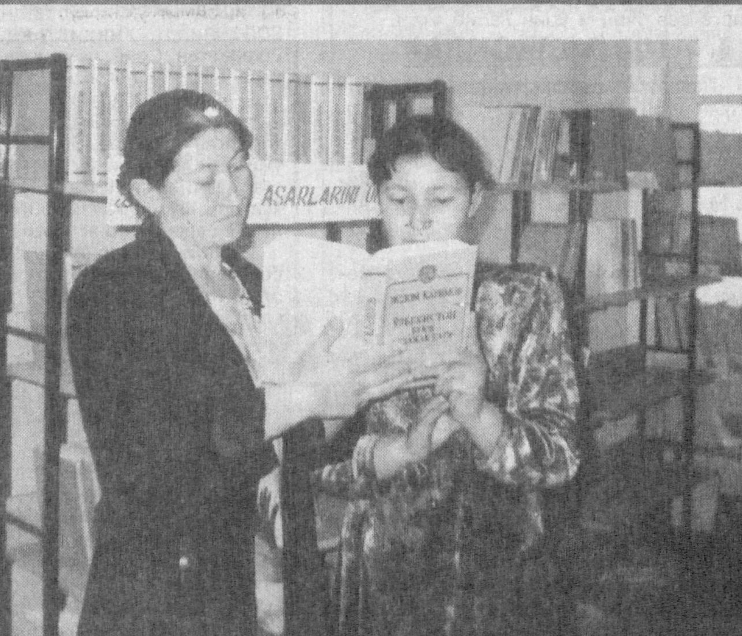
Бугунги кунда Бухоро туманидаги педагогика коллежида қўрлаб ёш-лар таҳсил олмоқда. Та-лабаларнинг ўқишлари, дам олишлари учун бу даргоҳда барча шарт-шароитлар муҳайё. За-монавий ётоқхоналар, шинам ошхона, кутубхона талабалар хизмат-лари. Ёшлар бўш вақт-ларини мазмунли ўтказиш учун барча шарт-шароитлар муҳайё этил-ган.

Бу ерда ўрнатилган энг замона-вий техноложик линиялар ишлаб чи-қариш ҳажмини изчил ошириб тури-ши имконини бермоқда. Ўз навба-тида, ишлаб чиқарилаётган маҳсулот барча халқаро сифат стандартлари-