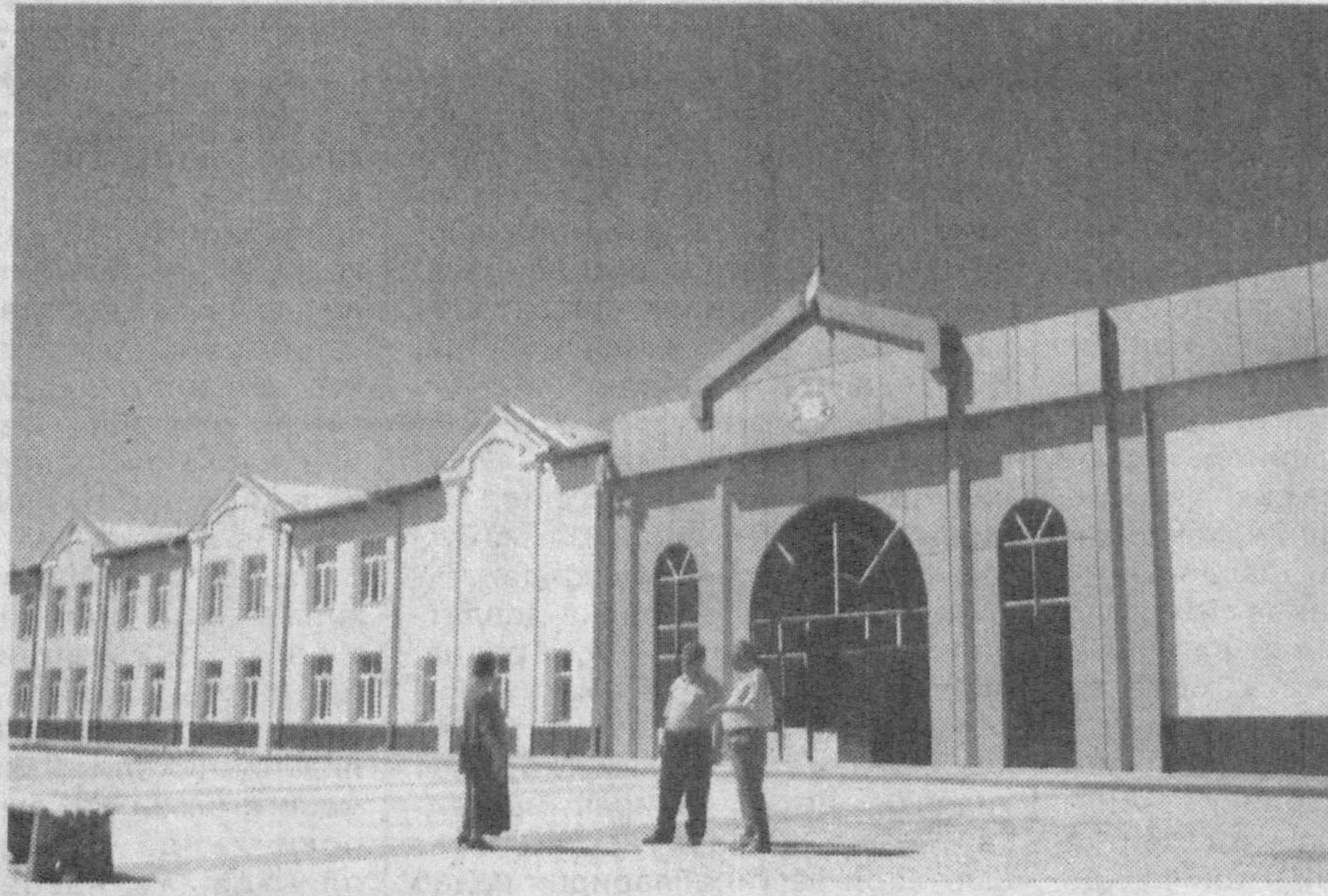
Абдуллаев; коллеж биноси кўриниши.