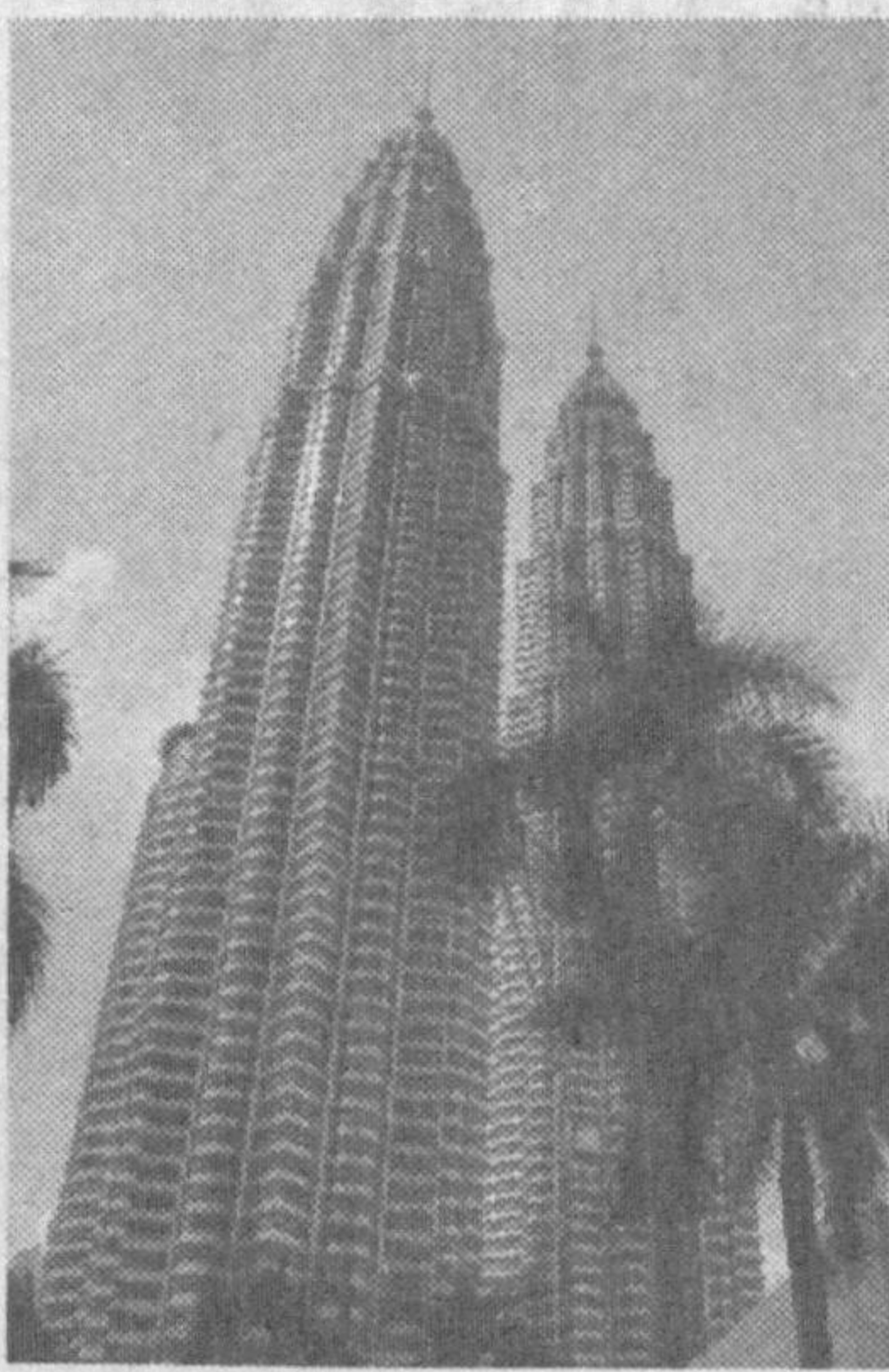
ё ўшашлигини назарда тутган ҳолда, Ўзбекистон доим халқаро майдонда ушбу давлатни қўллаб-қувватлаб келадим. Мисол учун, мамлакатимиз БМТ ҳузуридаги тузилмаларга аъзолик борасида кўп мартаба Малайзиянинг номзодини ёқлаган: 1997 йили - ЭКОСОСга, 1998 йили Хафсизлик кенгашининг номзодини аъзолигига, 1997, 2001 ва 2005 йиллари Югославия бўйича халқаро трибуналга, 2003 йили Руанда бўйича халқаро трибуналга, 2004 йили хотин-қизларни камситишинг барча шакллари бартараф этиш бўйича кўмитига.

Айни пайтда ушбу мамлакат Жануби-шарқий Осиёдаги энг нуфузли ташиқлик бўлиши АСЕАНга раислик қилмоқда. Аввалга, шунинг таъкидлаш ўринлики,