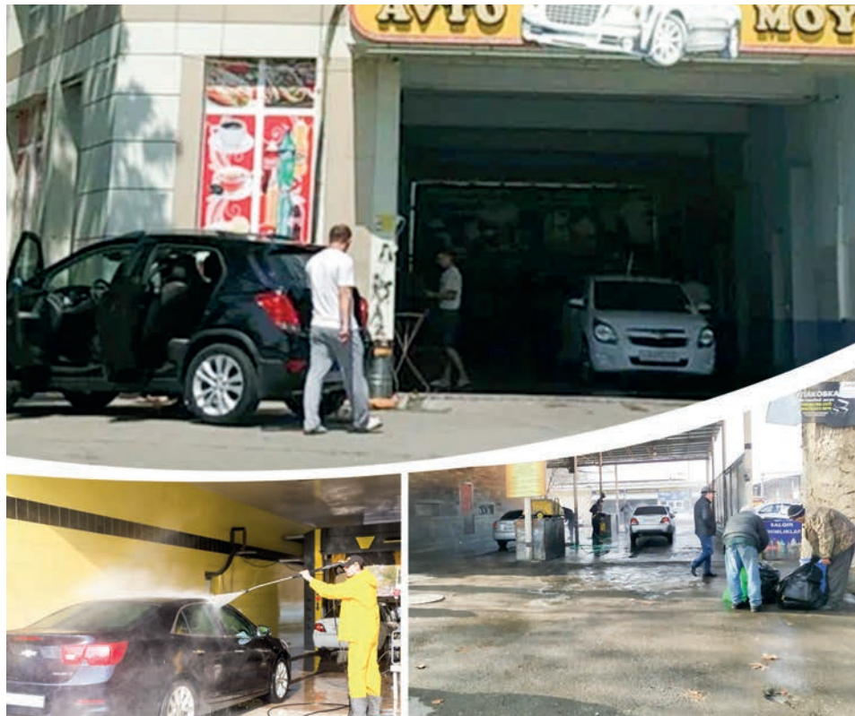
ча даромад топиш мумкин. Ёгингарчиликдан кейинги кунларда эса янаям кўпроқ фойда қолади”...

Билишимча, “мойка” очиш ҳам бугунги кун табири билан айтганда, ўзини банд қилиш ҳисобланади. “Ҳар ойда давлатга базавий ҳисоблаш миқдорининг бир бараварича солиқ тўлаймиз, холос, – деди ўша йилги. – Айрим кунлари камида 200-300 минг сўмга