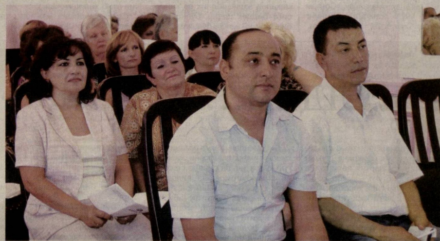
Давоми 2-бетда >>

соҳадаги мавжуд аҳволни аниқлашга, орттирилган тажриба ва мавжуд муаммоларни ўрганишга йўналтирилганлиги билан эътиборга лойиқдир.