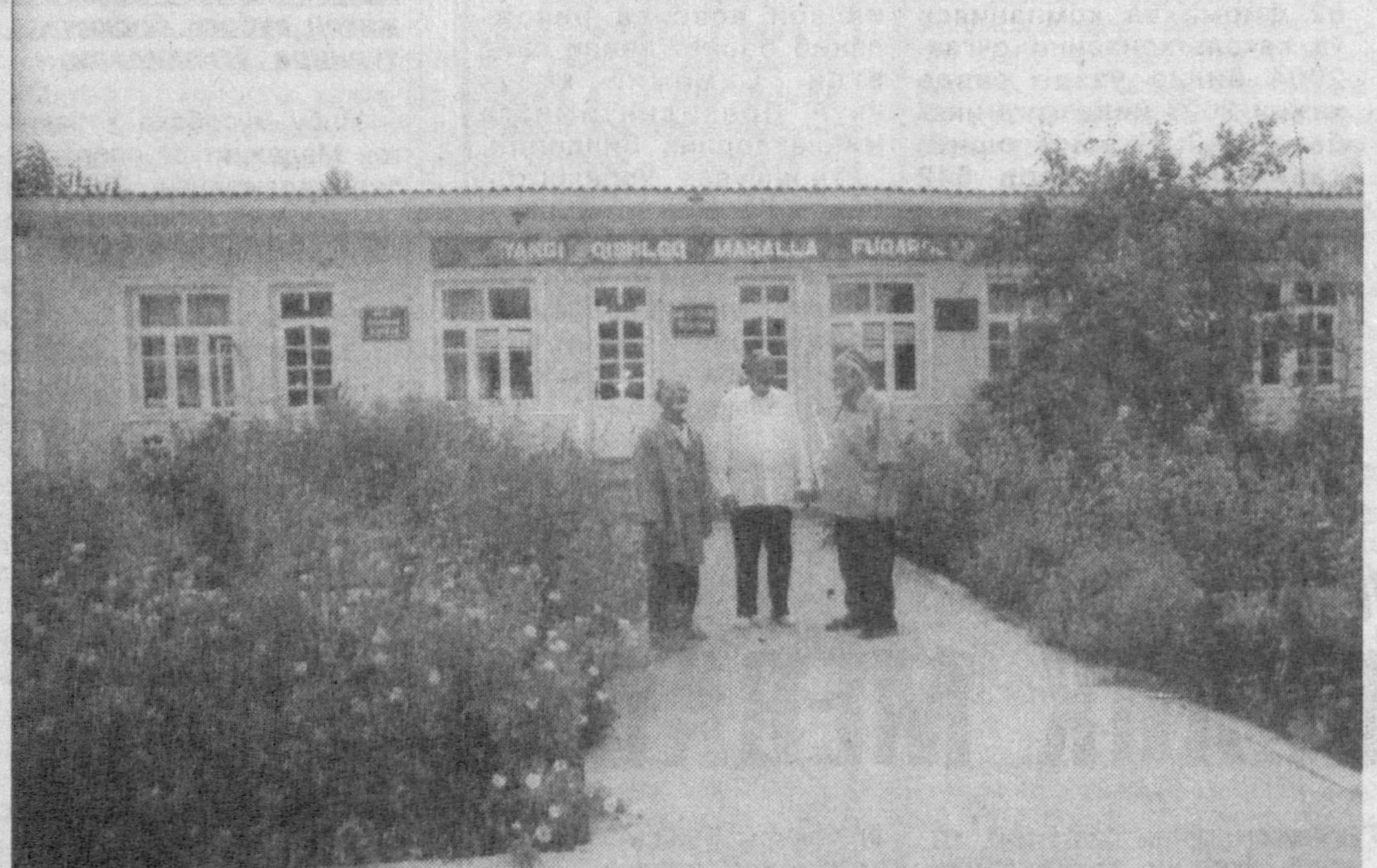
Данғара туманида кишлоқ гузарлари қурилишига катта эътибор қаратилмоқда. Гузарларда аҳоли эҳтиёжи учун керакли бўлган хизмат кўрсатиш шахобчаларининг бунёд этилаётганлиги маҳалла аҳлининг узогини яқин,

З.АСРОРОВ, Касби туманидаги А.Навой номли тажриба-элита уруғчилик хўжалиги раҳбари