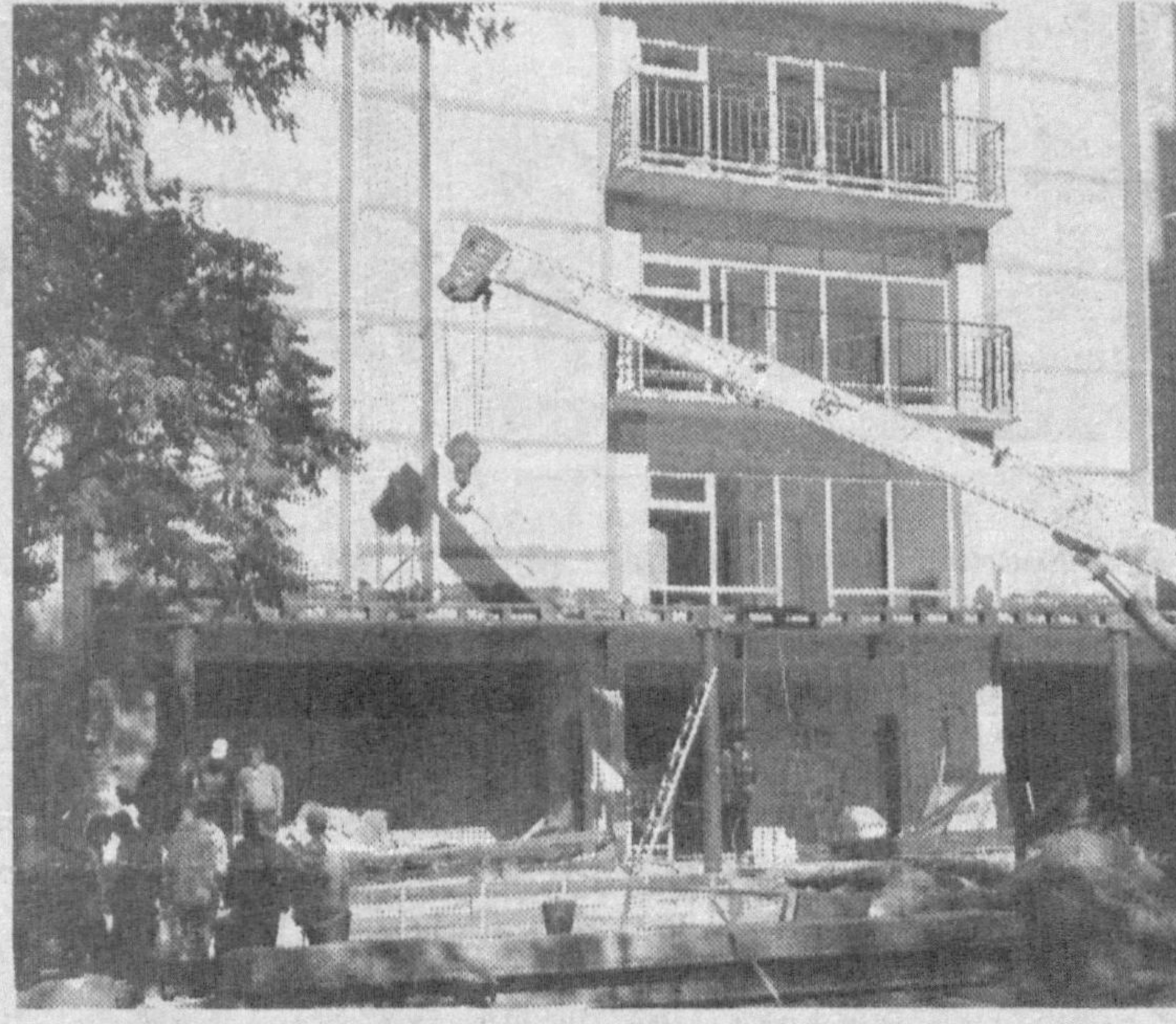
учта олий ўқув юрти, академик лицей, касб-ҳунар коллежи, малака ошириш институти ва бошқа таълим, илм-фан марказлари жойлашган. Қирқ битта ётоқхонада тўққиз минг нафарга яқин талаба истиқомат қилади.