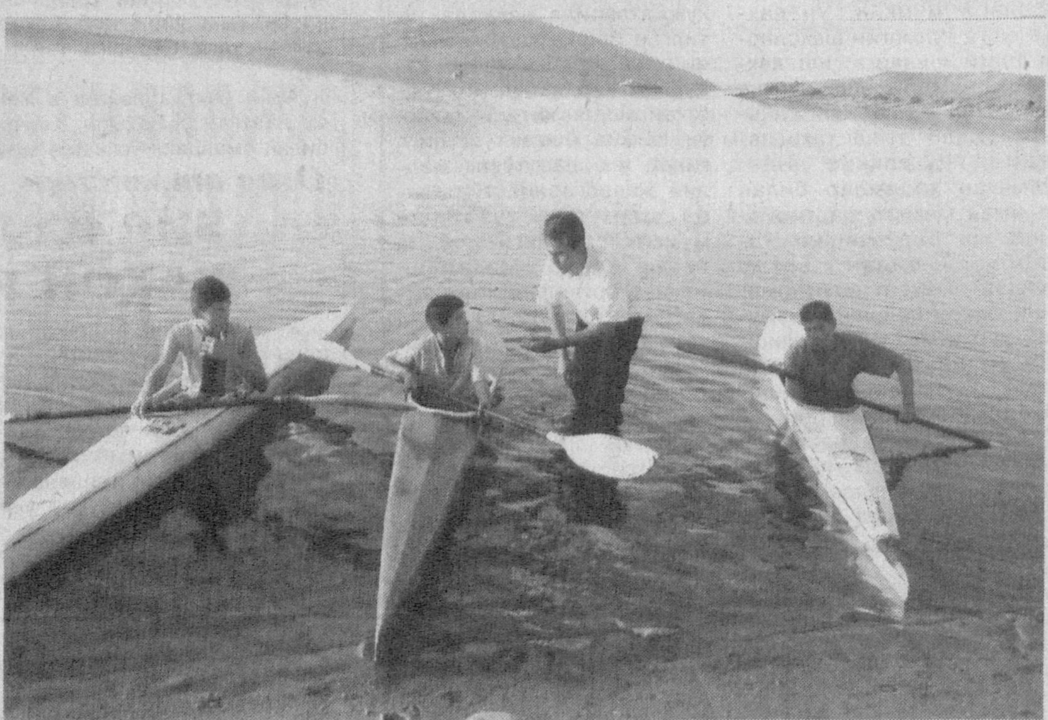
Айни пайтда бу ерда 22 нафар ўспиринлар 100 ва 500 метрга сузиш бўйича 2006 йили Чирчик шаҳрида бўлиб ўтadиган мусобақаларга тайёргарлик кўрмоқдалар. Не ажаб, ушбу ёшлар орасидан бўлгуси олимпиада чемпионлари етишиб чиқса.

Сўнги йилларда спортнинг эшак эшиш тури республикамиз ёшлари ўртасида кенг оммаланиб бормоқда. Усмир ёшлар Термиз туманида жойлашган Уч-қизил кўлида ташкил этилган болалар учун эшак эшиш сув спорти клубининг фаол аъзолари. Республикада Тошкент ва Самарқанд вилоятларидан сўнғ ушбу клуб учинчи бўлиб Сурхондарь вилоятида 2004 йилда ташкил этилди.