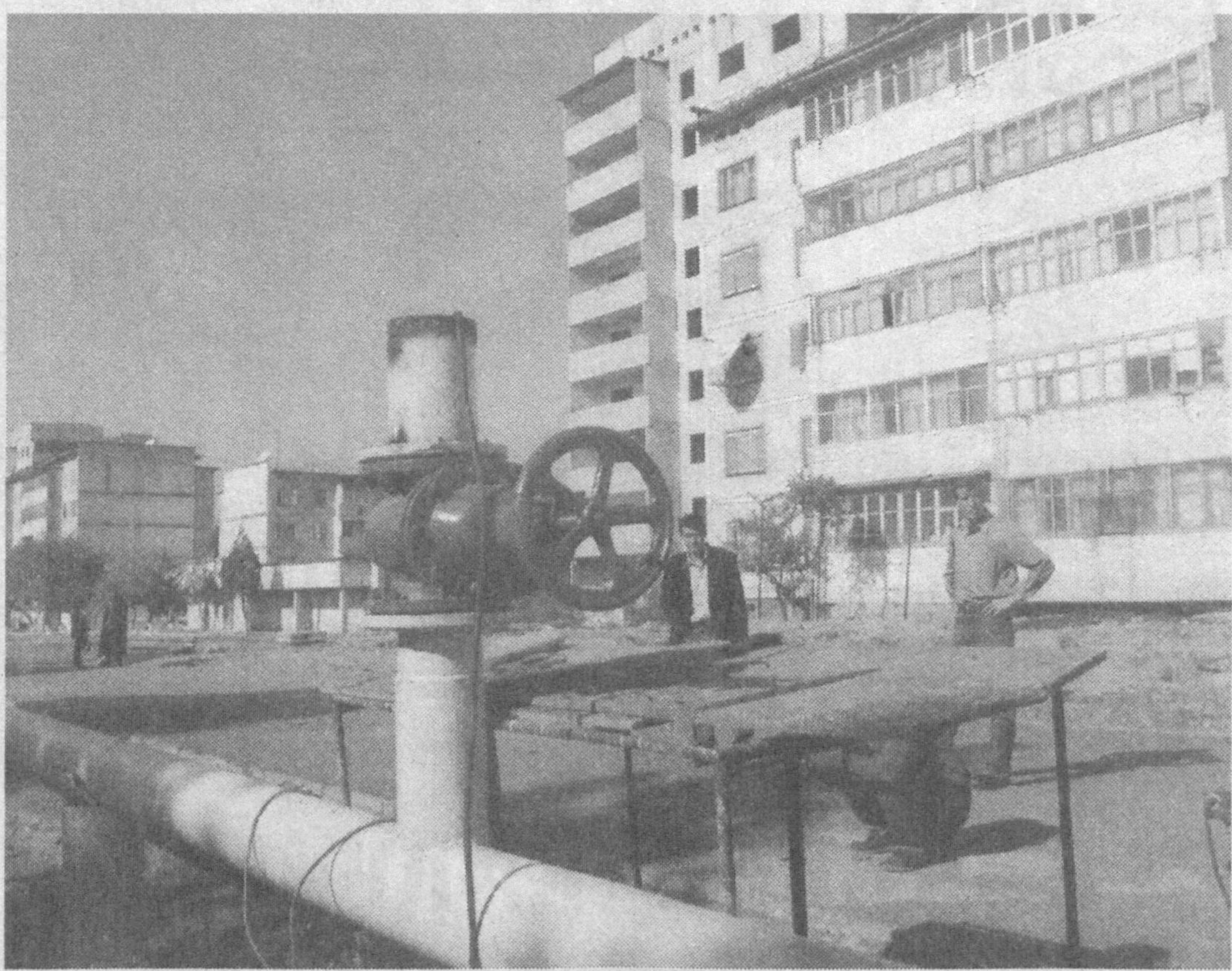
Тошкент вилоятининг Ангрэн шаҳрига жорий йилда илк бор табиий газ борди. Айни пайтда шаҳарнинг тўртта ҳудуди тўлиқ газлаштирилиб бўлинди.