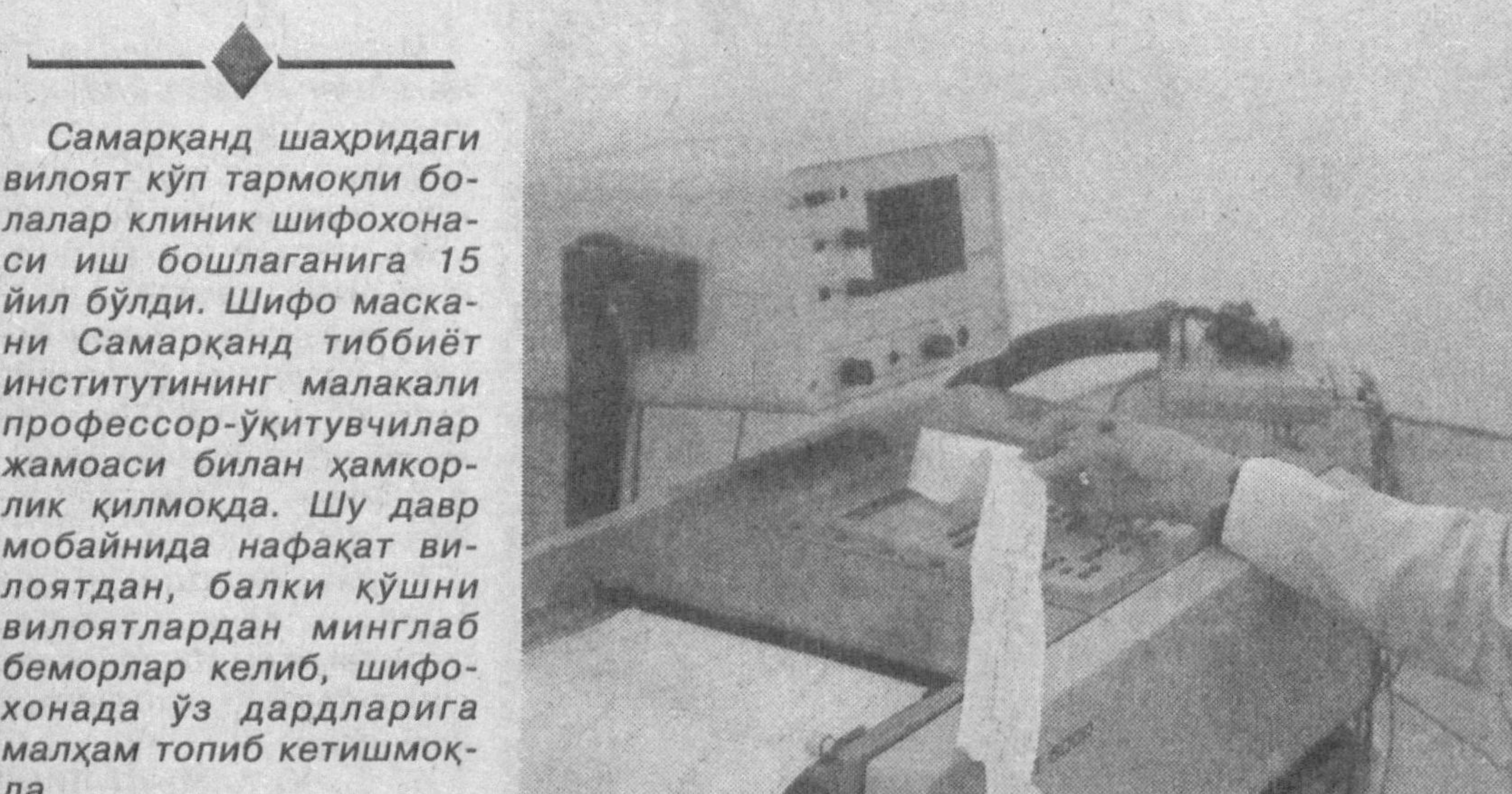
Самарқанд шаҳридаги вилоят кўп тармоқли болалар клиник шифохонаси иш бошлаганига 15 йил бўлди. Шифо маскани Самарқанд тиббиёт институтининг малакали профессор-ўқитувчилар жамоаси билан ҳамкорлик қилмоқда. Шу давр мобайнида нафақат вилоятдан, балки қўшни вилоятлардан минглаб беморлар келиб, шифохонада ўз дардларига малҳам топиб кетишмоқда.

Айни пайтда шифо маскани 320 нафар беморларга хизмат қилади. Шунингдек, бу ерда диагностика марказ ва эндоскопия хоналари мавжуд бўлиб, шулар қаторида яқинда қизлар ва ўсмир қизлар саломатлигини муҳофаза қилиш репродуктив маркази иш бошлади.