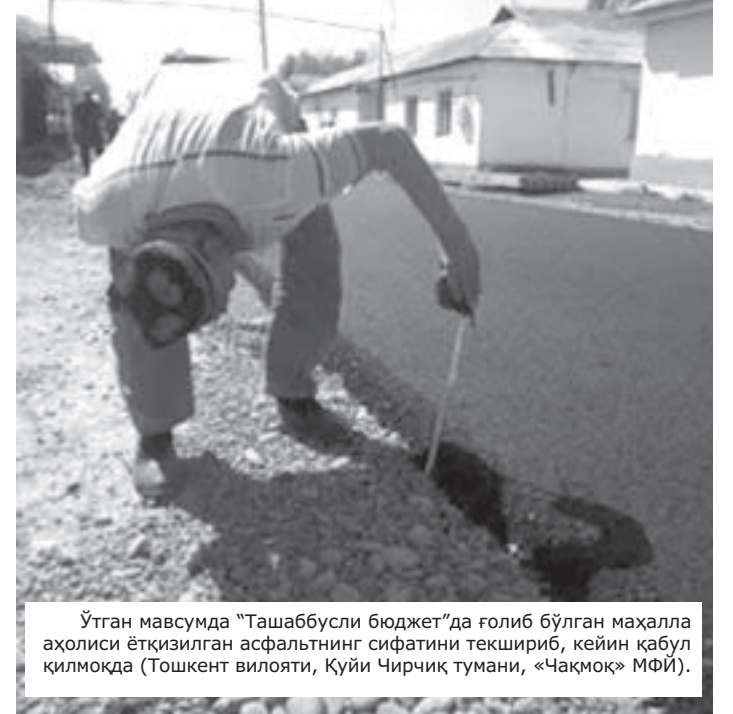
Ўтган мавсумда "Ташаббусли бюджет"да ғолиб бўлган маҳалла аҳолиси ётқизилган асфальтнинг сифатини текшириб, кейин қабул қилмоқда (Тошкент вилояти, Қуйи Чирчиқ тумани, «Чақмоқ» МФЙ).

» Инстинкт бўлганда миллат учун, халқ учун энг муҳим ҳаётини бўлиш, буюк бўлиш инстинкти. Бугун ўзининг маҳалласи ёки қишлоғи учун бирлаша олган одамлар эртага юртимиз ривожини учун олий мақсад бирлаша олади