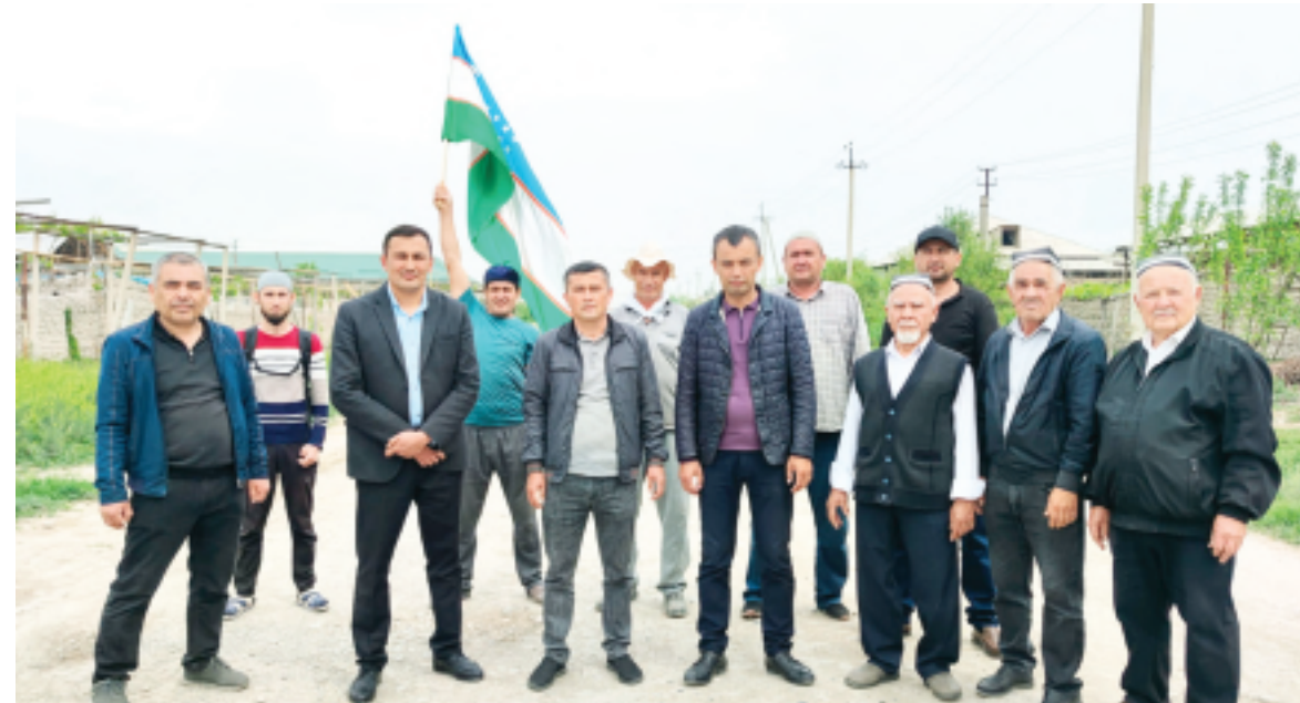
Фарғона вилояти Олтиариқ тумани «Кўмирчи» маҳалласида 3 677 нафар фуқаро истиқомат қилади. Шу кунгача «Ташаббусли бюджет»нинг учта босқичида маҳалланинг жами 5,5 км ички йўллари асфальтланди. Бу тўртинчи ғолиблиқда яна 2,7 км масофадаги кўчалар асфальт бўлади.

» Инстинкт бўлганда миллат учун, халқ учун энг муҳим ҳаётини бўлиш, буюк бўлиш инстинкти. Бугун ўзининг маҳалласи ёки қишлоғи учун бирлаша олган одамлар эртага юртимиз ривожини учун олий мақсад бирлаша олади