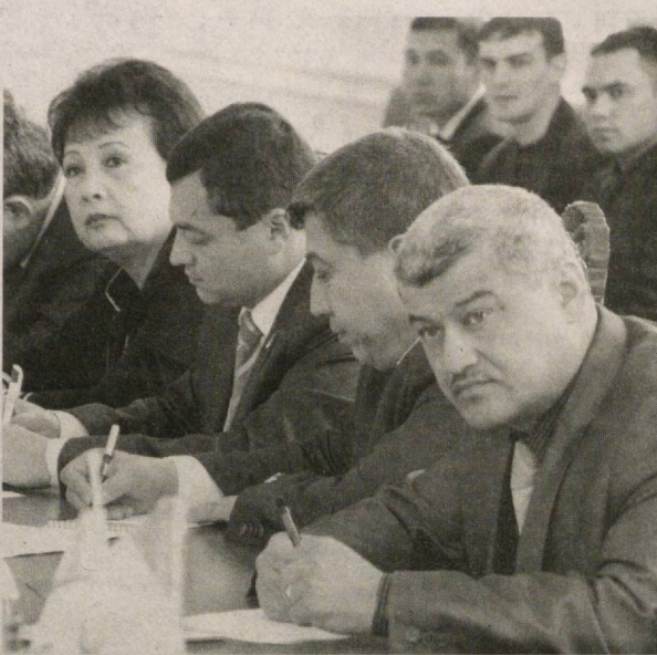
дан 431 нафар депутат сайланди.

Маълумки, ҳар бир сиёсий партиянинг бош мақсади сиёсий ҳокимиятни эгаллаш, унга таъсир ўтказишдан иборат. Шу қаторда Ўзбекистон "Адолат" СДП ҳам 2009 йилда бўлиб ўтган сайловларда барча даражадаги ҳокимият вакиллик органларида кўп ўринга эга бўлиш ва шу аснода мамлакатимизда амалга оширилаётган кенг қўламли ижтимоий-сиёсий, социал-иқтисодий ислохотларни рўёбга чиқариш, ўз электротики манфаат ва эҳтиёжларини эътиборга олган ҳолда, жамият ва давлат қурилиши жараёнида фаол иштирок этиши ўз олдида асосий вазифа қилиб қўйган эди. Сайловлар натижасида партия Олий Мажлис Қонунчилик палатасида 19 ўринни қўлга киритди. Қорақалпоғистон Республикаси Жўржор Кенгеси, Халқ депутатлари вилоят Кенгашига Ўзбекистон "Адолат" СДП қўрсатган нозодлардан 68 нафар, туман Кенгашига 300 нафар, шаҳар Кенгашига 63 нафар сайланди, жами халқ депутатлари вилоят, туман, шаҳар Кенгашиларидаги мавжуд 6124 нафар ўринга партия-