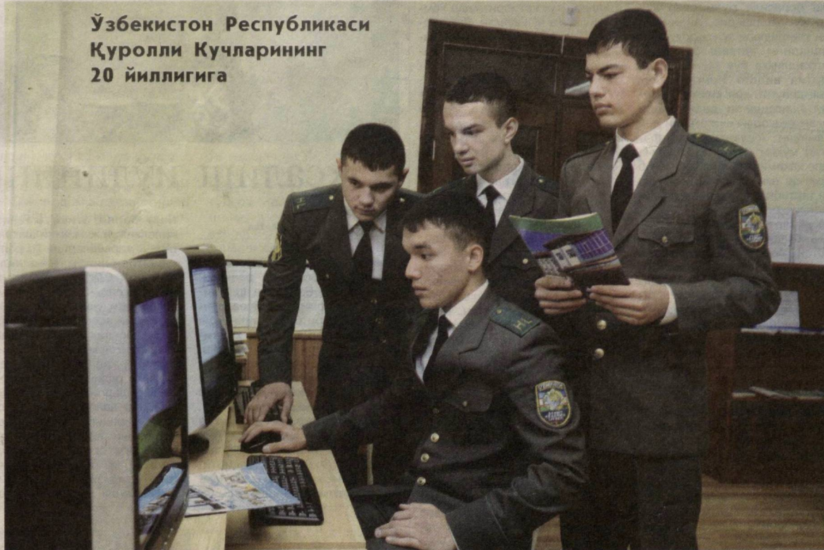
Ўзбекистон Республикаси Қуролли Кучларининг 20 йиллигига