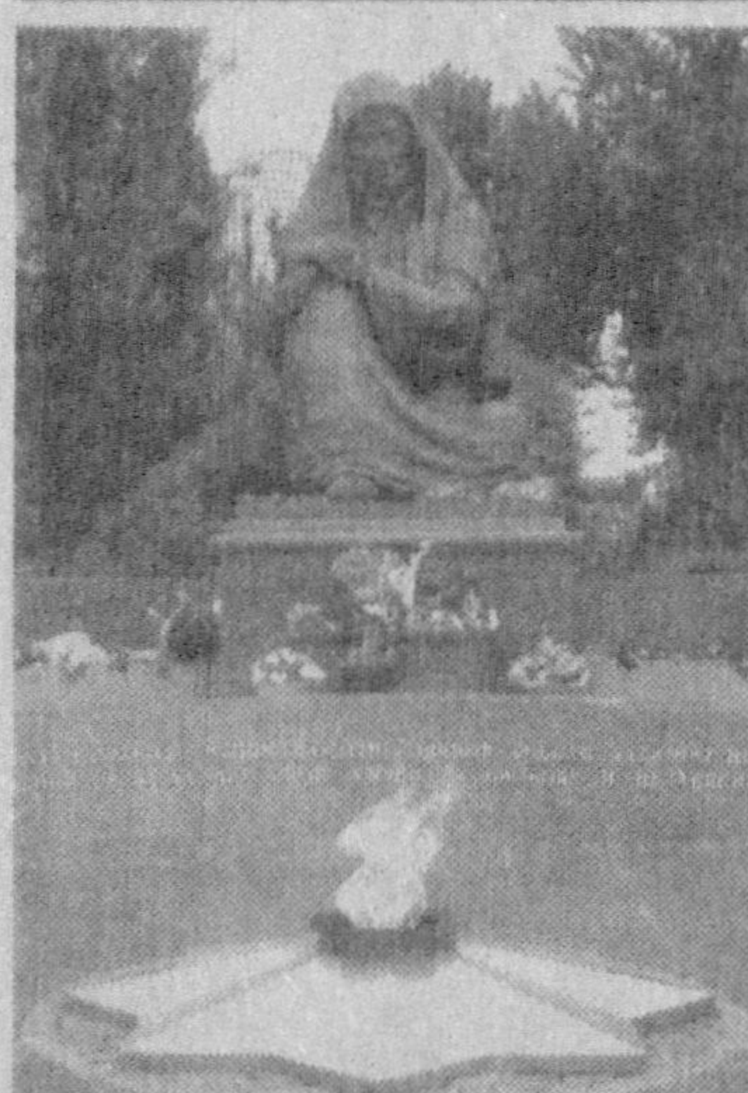
МОТАМСАРО ОНА — МИЛЛАТ ТИМСОЛИ

Пойтахтимиз юраги — Мустақиллик майдонидаги Хотира мажмуаси бугун ҳар қачонгидан гавжум. Зийратчиларнинг кети узилмайди. Айниқса, улар сафини тўдириб келадиган ёшларни кўриб кўнгил ёришади.