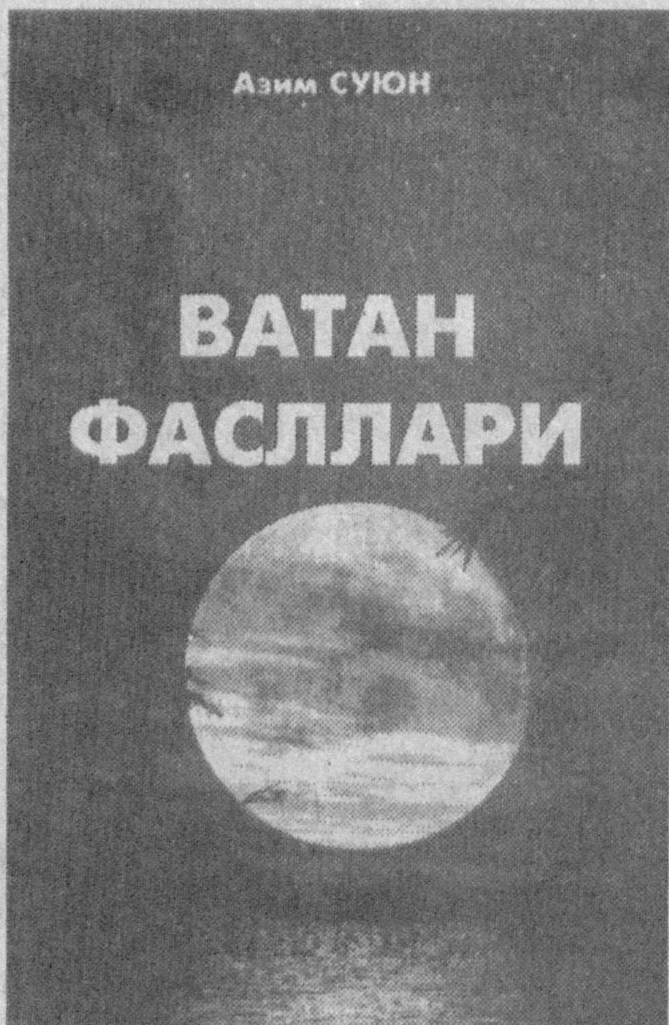
Азим Суюн ВАТАН ФАСЛЛАРИ